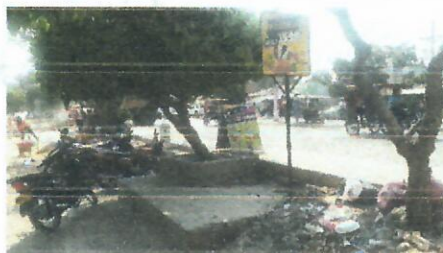
Calle 13 entre Carrera 15 y 16