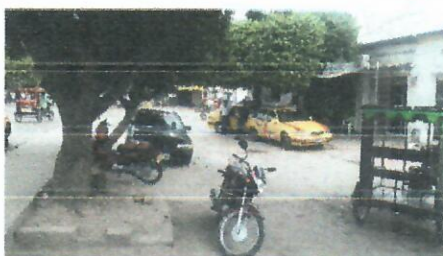
Calle 13 entre carrerar 16 y 17