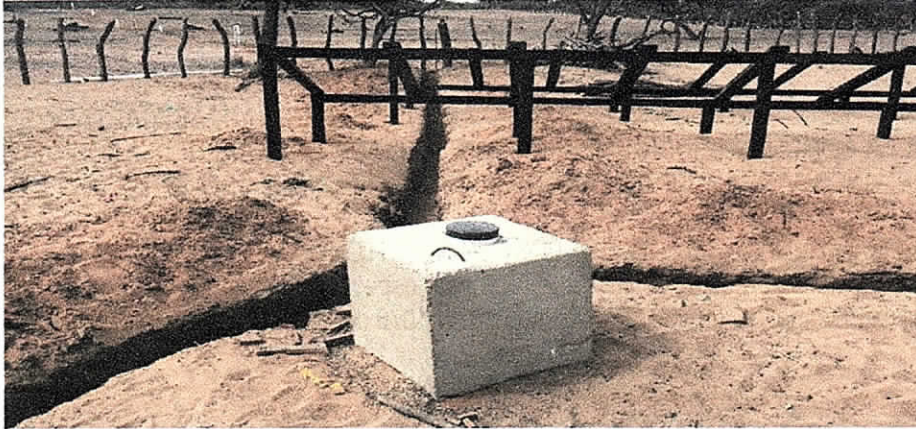
Fotografía 1. Predio visitado (Captación)