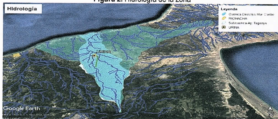
Figura 2. Hidrología de la zona