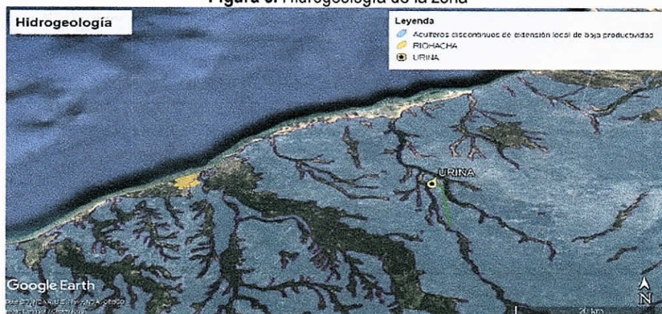
Figura 3. Hidrogeología de la zona

La zona estudiada en la comunidad de URINA, se localiza sobre sedimentos cuaternarios y rocas sedimentarias terciarias poco consolidadas de ambiente aluvial lacustre, coluvial, eólico y marino marginal. Acuíferos libres y confinados. La hidrogeología corresponde a acuíferos discontinuos de extensión local de baja productividad (ver figura 3).