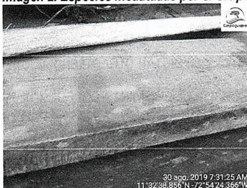
Ceiba bonga – Ceiba pentandra

Distrito de Riohacha, La Guajira, 30 agosto de 2019