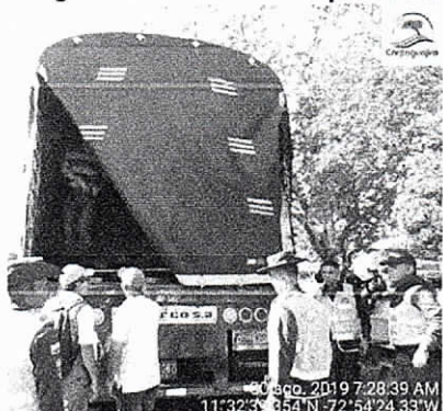
Vehículo con madera sin salvoconducto Distrito de Riohacha, La Guajira, 30 agosto de 2019