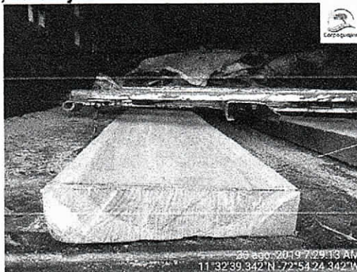
Moncoro o Solera – Cordia gerascanthus

Distrito de Riohacha, La Guajira, 30 agosto de 2019