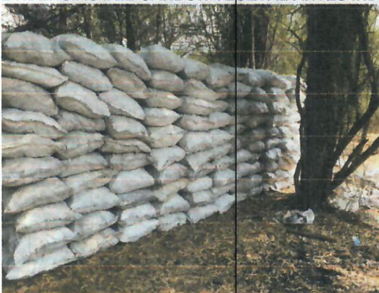
Imagen No 1