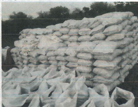
Imagen No 2