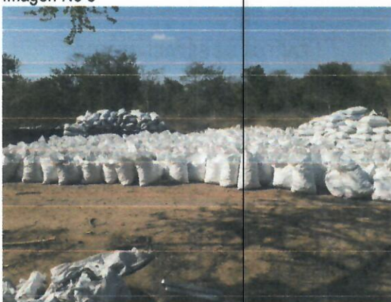
Imagen No 5