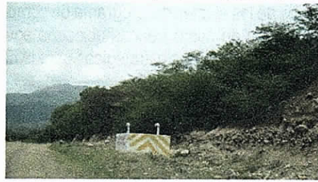
Fotos No 4 y 5. . Erosión de taludes corredor vial línea de conducción Ranchería. Proyecto Ranchería. Octubre 9 de 2015

La situación sigue en iguales condiciones.