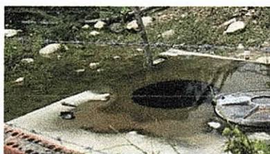
Foto2. Derrame de pozo. 9 de octubre de 2015

En este tramo lo relevante o pendiente por revisar de conformidad con la visita anterior era lo correspondiente a la fuga de agua en la purga del kilómetro 4 mas 352 metros. En la presente visita se observó que se tomaron los correctivos le caso, no ha fugas, ni brote de agua.