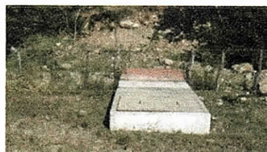
Foto 3. Control de fugas en pozo. 9 de dic. de 2015