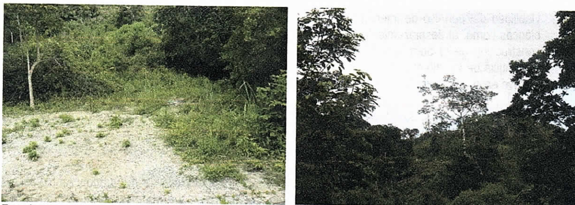
Foto izquierda, sitio donde anteriormente depositaron los materiales para la construcción de la antena, Foto derecha, muestra parte de la trocha donde la empresa movistar realizo la tala.