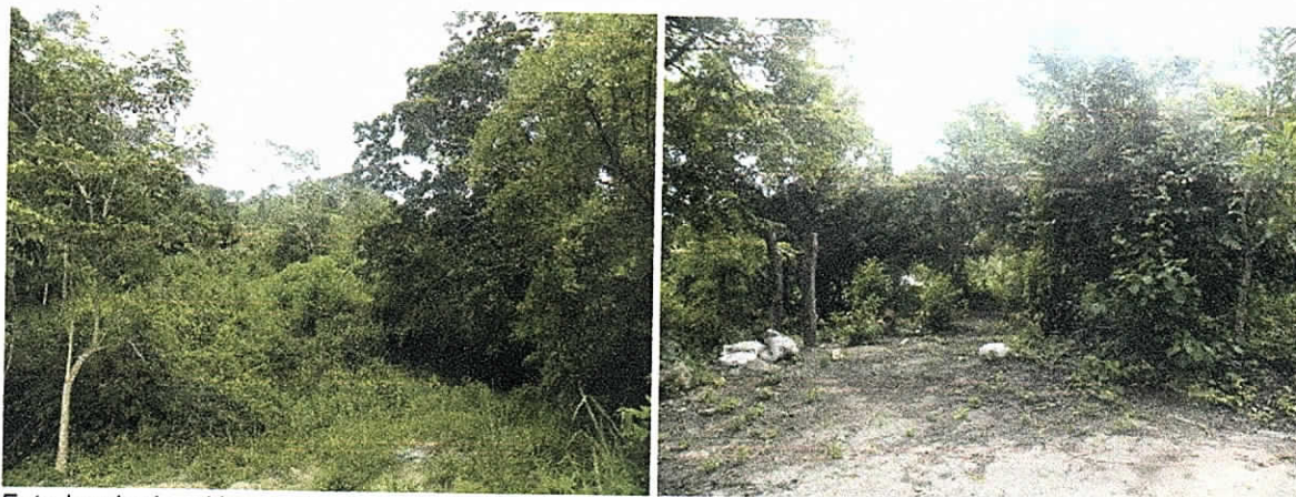
Foto Izquierda, sitio por donde se instaló la carrucha. Foto derecha, lugar donde realizaban la preparación y embarque del material de fundición (Concreto) que utilizaron para la fundición de las bases para el montaje de la antena y con la cual también transportaron las secciones metálicas para dicha infraestructura.