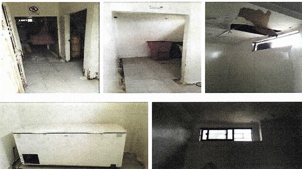
Fotografías No 6 – 10. Instalaciones del cuarto de almacenamiento de residuos hospitalarios del hospital San José de Maicao. Seguimiento realizado 19 de abril de 2018.