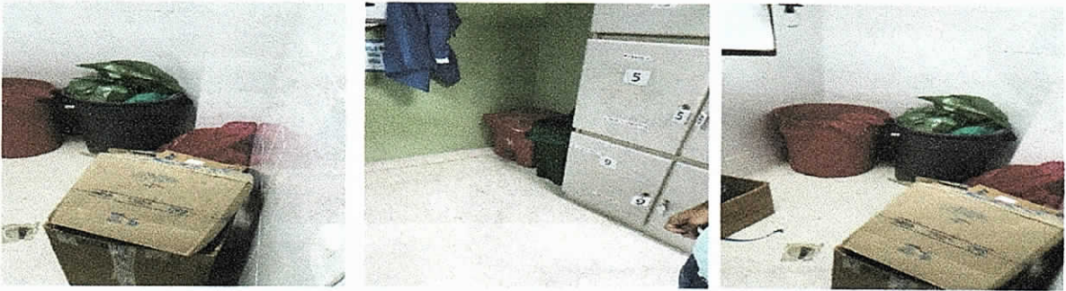
Fotografías No 9 – 11. Almacenamiento interno.

Evidencias fotografías de las condiciones de almacenamiento y manejo de residuos hospitalarios evidenciadas en el seguimiento realizado al hospital San Jose de Maicao en el año 2017.