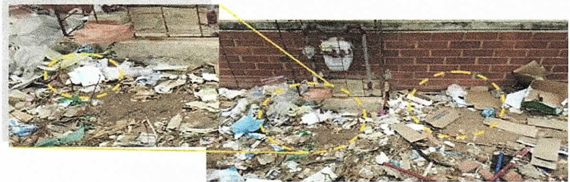
Fotografías No 2 – 3. Empaques de medicamentos llenos y vacíos tirados en el suelo por fuera de las instalaciones del hospital. Seguimiento realizado 19 de abril de 2018.