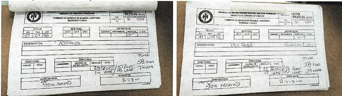
Fotografías No 12 - 13. Formatos RHPS entregados por el hospital San José de Maicao.