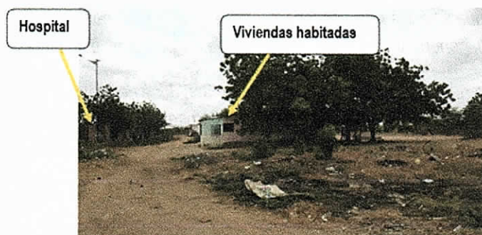
Fotografía No 1. Vivienda habitada, ubicada en la parte de atrás del hospital. Seguimiento realizado 19 de abril de 2018.