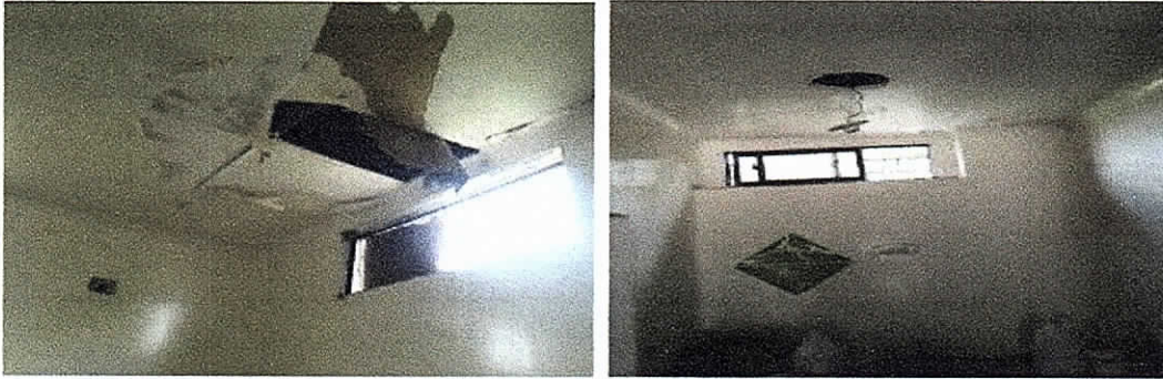
Cuarto donde se almacenan los residuos o desechos peligrosos generados en el Hospital San José de Maicao, presentando aberturas en los techos. Seguimiento realizado el 10 de agosto de 2017.