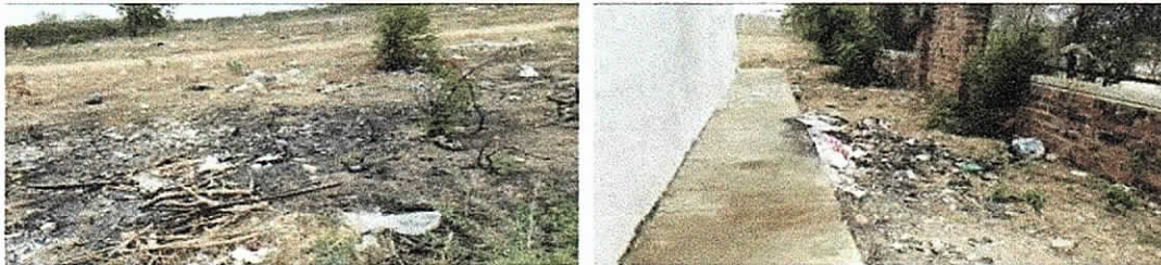
Fotografías No 4 – 5. Quemas de residuos realizadas en los costados del cuarto de almacenamiento de residuos hospitalarios. Seguimiento realizado 19 de abril de 2018.