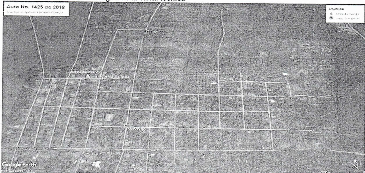
Imagen Google Earth, 2019 – Fuente CORPOGUAJIRA