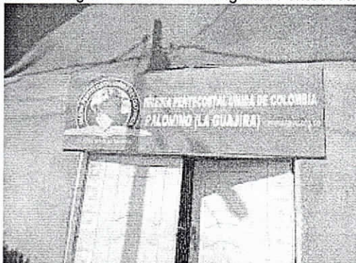
Calle 3 con carrera 4, corregimiento de Palomino. Municipio de Dibulla, 14/02/2019