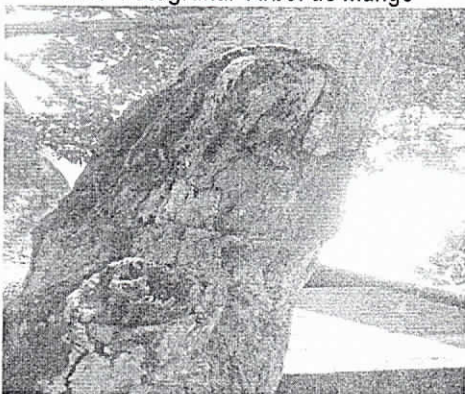
Calle 3 con carrera 4, corregimiento de Palomino. Municipio de Dibulla, 14/02/2019