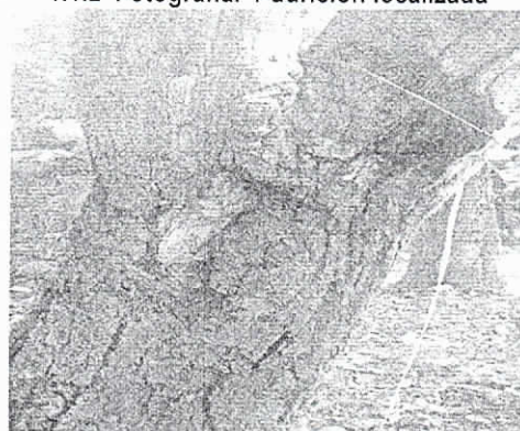
Calle 3 con carrera 4, corregimiento de Palomino. Municipio de Dibulla, 14/02/2019