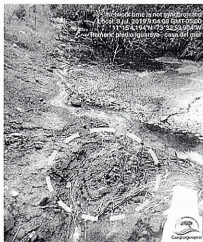
Fotografías 5 y 6. Nuevos rebrotes de mangle en el descole del Box Couvert 3.. (Fuente: CORPOGUAJIRA 2019).