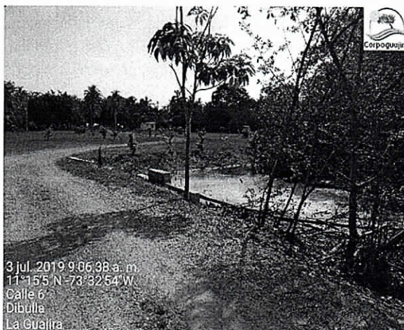
Fotografía 1. Estado del flujo de agua en el predio Iguaraya.