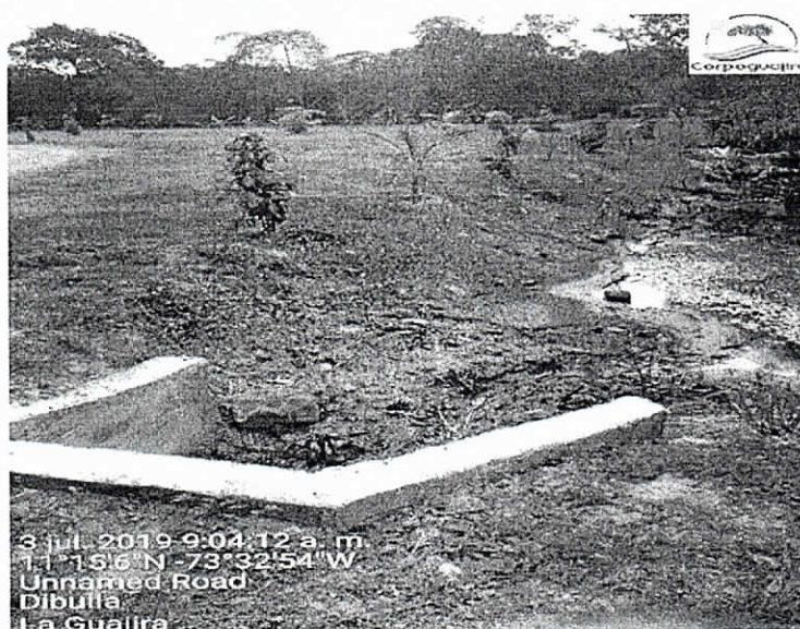
Fotografía 8. Situación actual del Box coulvert No. 3

Siendo que la quema se realizó en el descole o salida del Box Coulvert, no se generó ningún daño al mangle presente en la zona y actualmente no existe taponamientos que impidan el flujo de agua, tal como se observa en la siguiente fotografía.