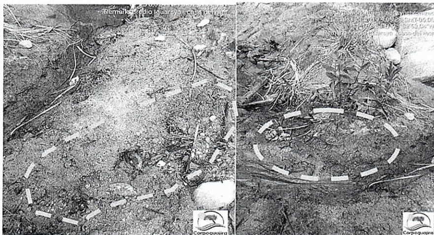
Fotografías 2 y 3. Sitio donde se realizó la quema registrada en el informe INT 5052 de 2018.