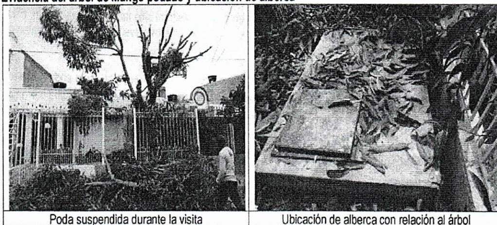
Poda suspendida durante la visita