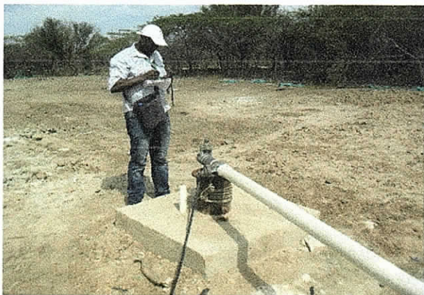
Imagen 1. Pozo casa azul hecho por el S.G en uso