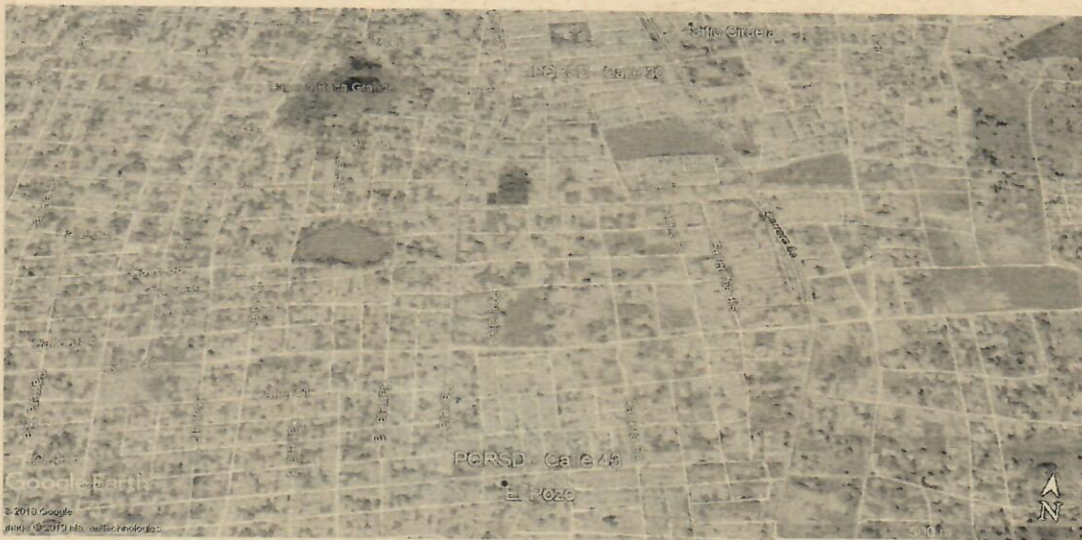
Imagen 1: Ubicación geográfica del sitio de la queja carrera 7H entre las calles 30 y 43 – Riohacha La Guajira

Se realizó visita de inspección ambiental el día 12 de julio de 2019 en el Distrito de Riohacha, La Guajira, en el sector avenida 7H entre la calle 30 y 43 de esta localidad, para verificar la información suministrada a la Corporación Autónoma Regional de La Guajira "CORPOGUAJIRA", mediante queja cuyo número de radicado es ENT – 862 del 08/02/2019, mediante la cual se menciona que existe una afectación ambiental debido al desperdicio de agua potable en la calle.