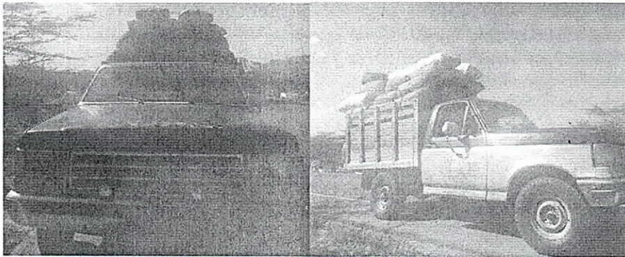
Se evidencia la placa del vehículo (RO9364)

NOTA. En el momento del decomiso la Autoridad Ambiental no contaba con acta única de control al tráfico ilegal de flora y fauna silvestre, dado que por inexistencia de las mismas, se había solicitado al MADS, nuevos consecutivos para proceder a cotizar impresión de los nuevos seriales adjudicados; por tal razón quedaron algunos decomisos sin entregarse formalmente en la Subdirección de Autoridad Ambiental y Secretaria General para los trámites pertinentes pero el funcionario de logística estaba enterado del decomiso para lo de su interés.