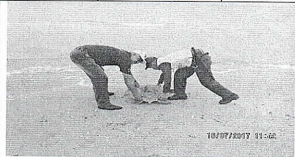
Liberación de los especímenes