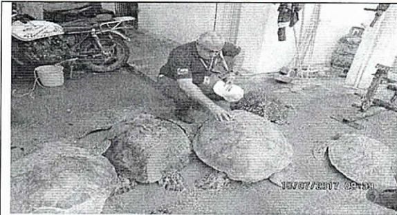
Identificación y valoración de los especímenes