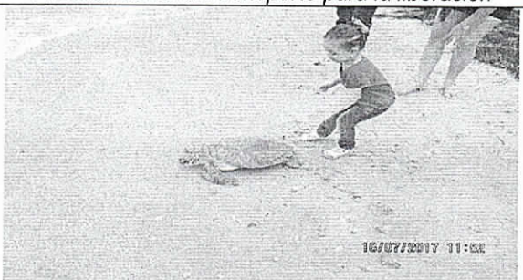
Otras evidencias de la liberación