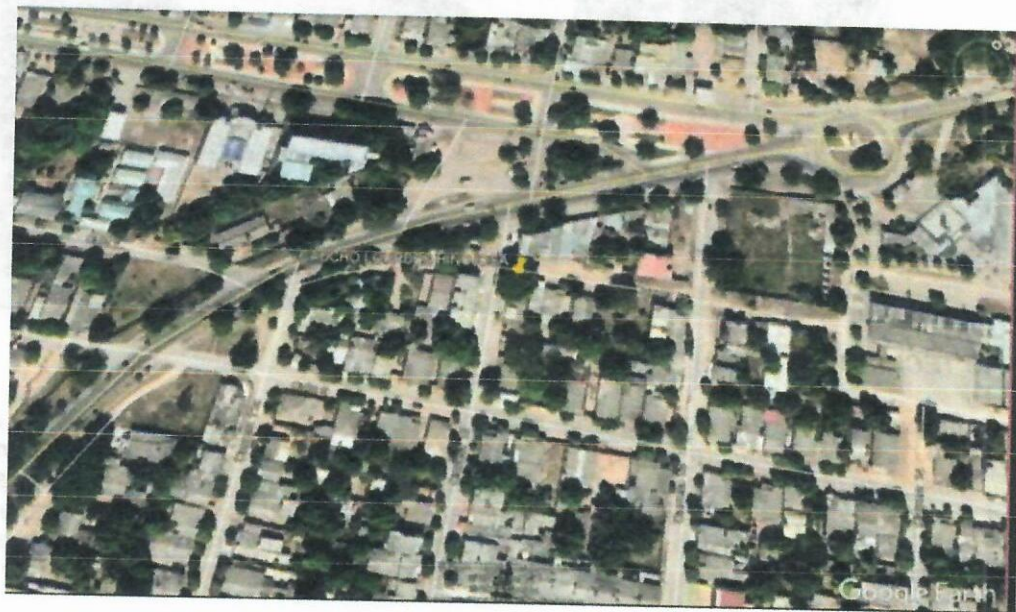
Imag. 2. Árbol de la especie Caucho.