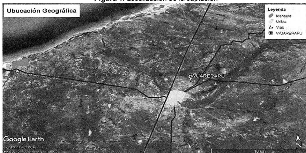
Figura 1. Localización de la captación

El área objeto de la solicitud se localiza en la comunidad indígena de GUARERAPU, para llegar hasta allí, se recomienda partiendo desde Uribe, por vía terrestre, tomar la vía que conduce hacia el Cerro de La Teta, luego de 3 km cruzar a la derecha, a 1 km se encuentra la comunidad de GUARERAPU. El punto donde se realizó la perforación se localiza en las coordenadas mostradas en la Tabla 1 y en el punto indicado en la Figura 1.