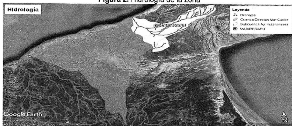
Figura 2. Hidrología de la zona

El punto de perforación se localiza sobre la Cuenca Directos al Mar Caribe, en la subcuenca del Arroyo Kutanamana (ver figura 2). Relativamente cerca al punto de captación proyectado se encuentran fuentes hídricas superficiales como el arroyo Chemerrain y Ay. Masopomana.