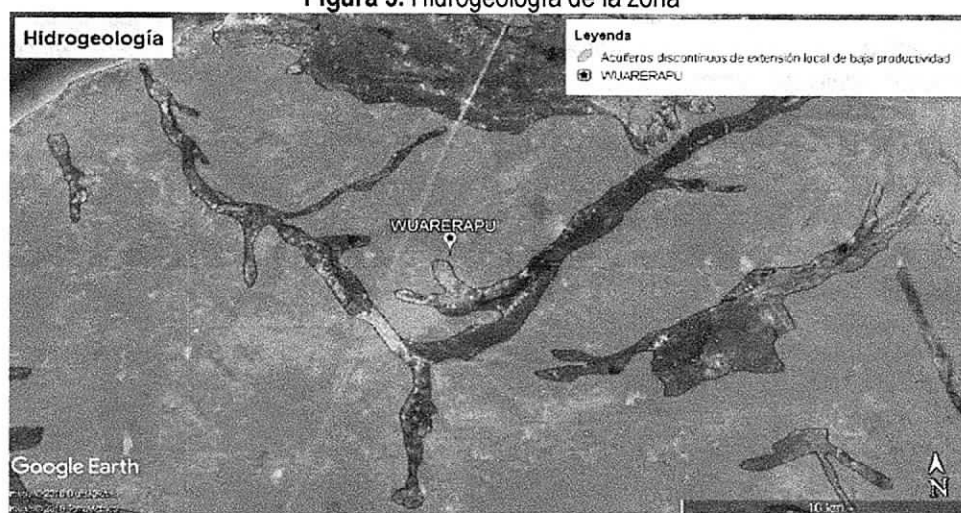
Figura 3. Hidrogeología de la zona

La zona estudiada en la comunidad de GUARERAPU, se caracteriza por la presencia de acuíferos discontinuos, libres y confinados de extensión local de baja productividad, conformados por sedimentos cuaternarios y rocas sedimentarias terciarias poco consolidadas de ambiente aluvial, lacustre, coluvial, eólico y marino marginal (ver figura 3).