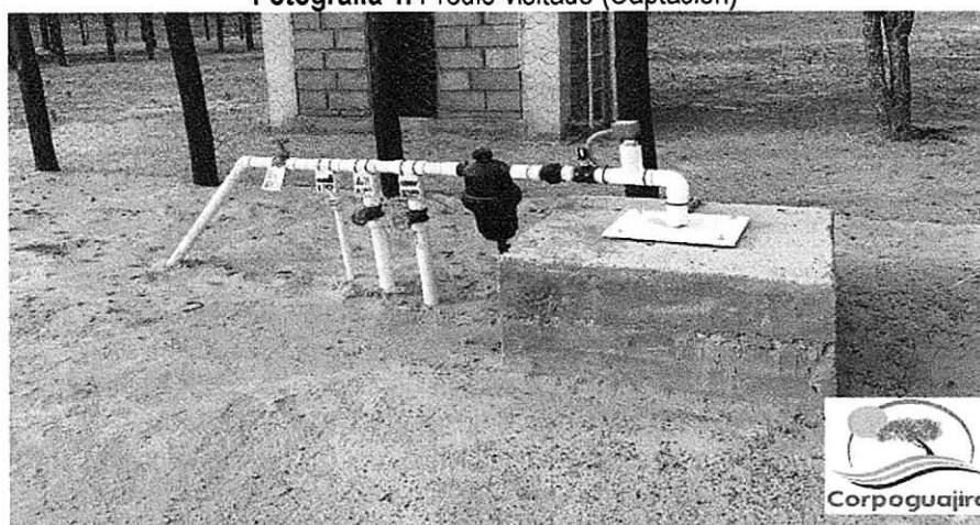
Fotografía 1. Predio visitado (Captación)

El 11 de Marzo de 2019 se realizó visita técnica para evaluar la solicitud de concesión de aguas subterráneas del pozo ubicado en la comunidad indígena de GUARERAPU en jurisdicción del municipio de Uribe (ver Fotografía 1). En campo se procedió a localizar las coordenadas del punto indicado en el formulario de solicitud de permiso de concesión de aguas subterráneas. De igual manera, se realizó un recorrido con el fin de identificar las características de la zona donde se localiza el pozo: cuerpos de agua cercanos, presencia de otros aprovechamientos de agua subterránea, fuentes potenciales de contaminación, usos del suelo y vertimientos.