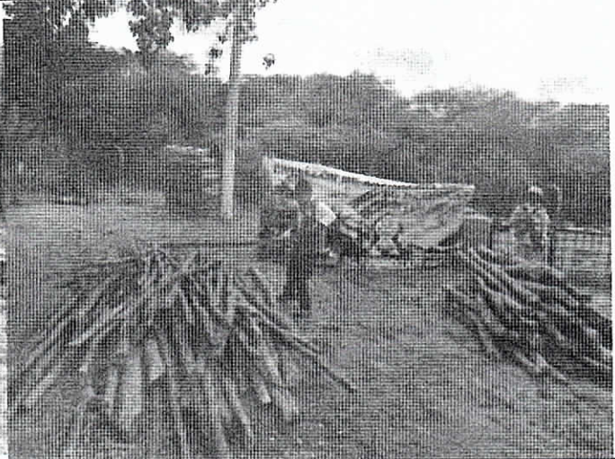
Foto 4. Varas y puntales de yaguaró ubicadas en la Base del Ejército de Artillería de Defensa Antiaerea de Albania, La Guajira.