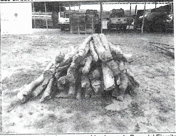
Foto 2. Puntales de yaguaró ubicadas en la Base del Ejército de Artillería de Defensa Antiaerea de Albania, La Guajira