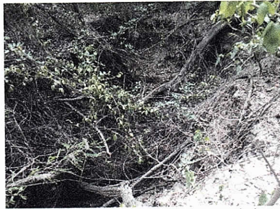
Fotos 3 y 4: Canal por donde transitan las aguas procedentes del Embalse 3 hasta su punto vertimiento.