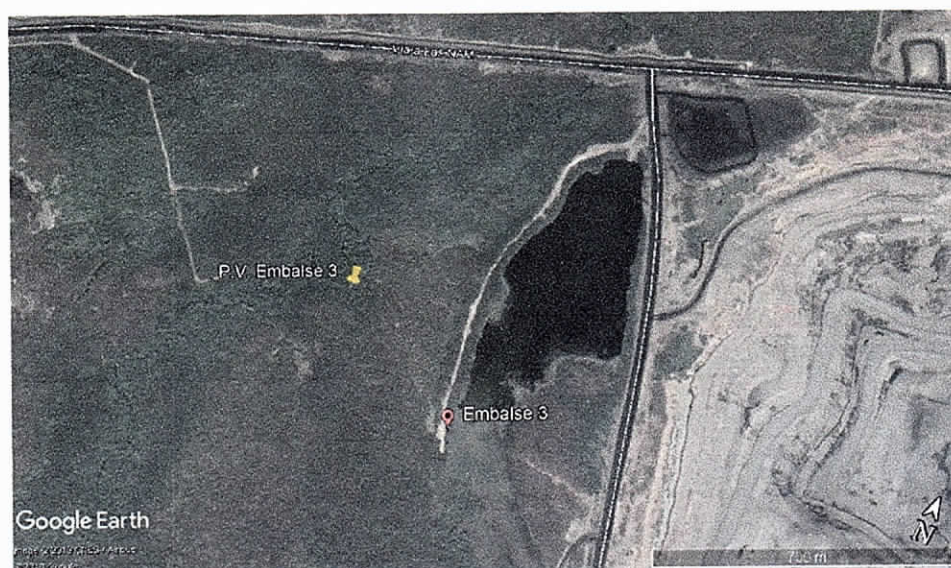
Imagen 2. Ubicación del Embalse 3 y su punto de vertimiento.