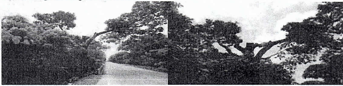
El puente donde se ubica esta poda, es antes de la entrada al predio río claro.

Evidencias del árbol de Caracolí podado, obsérvese las líneas de conducción eléctrica por encima de la copa en el registro fotográfico de la derecha.