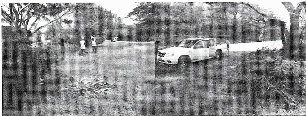
Residuos de la poda repicados en el sitio