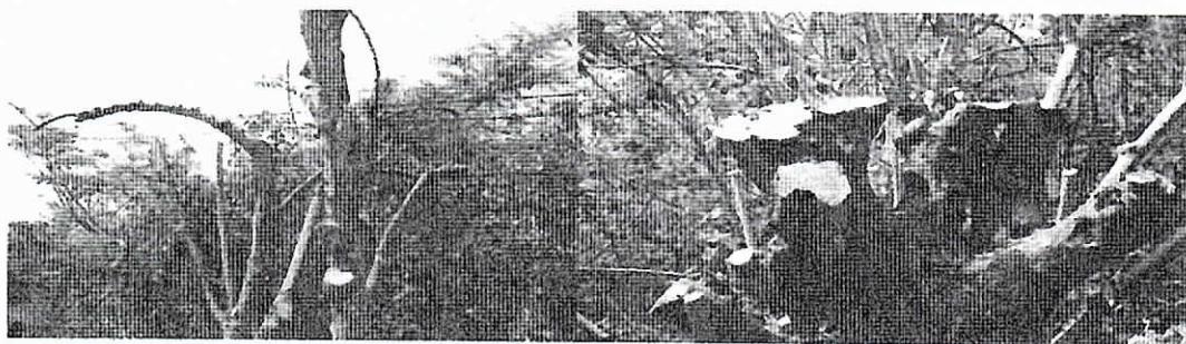
Mataratón (Gliricidia sepium)