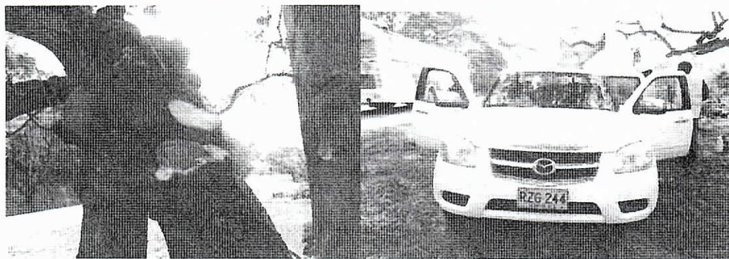
Guácimo (Guazuma ulmifolia)