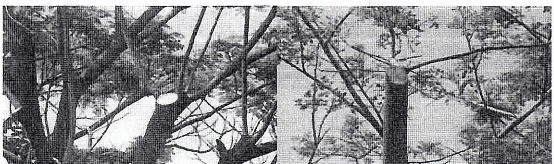
Especie algarrobillo (Samanea samán)

Evidencia de las podas que se vienen realizando en km PR24+300 al km PR 25+998 del tramo de vía Mingueo - Riohacha.