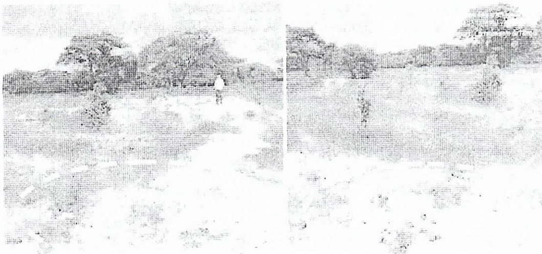
Fotografías 5 – 6. Evidencia de animales en el área de lagunas de oxidación. Corregimiento de Mongui. 26 Agosto del 2019.