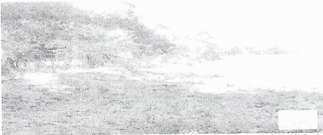
Fotografías 7- 9. Jarillno de contención perimetral para contrarrestar el riesgo de inundación en el área donde se localizan las lagunas de oxidación. Corregimiento de Mongui. 4 de febrero de 2019.