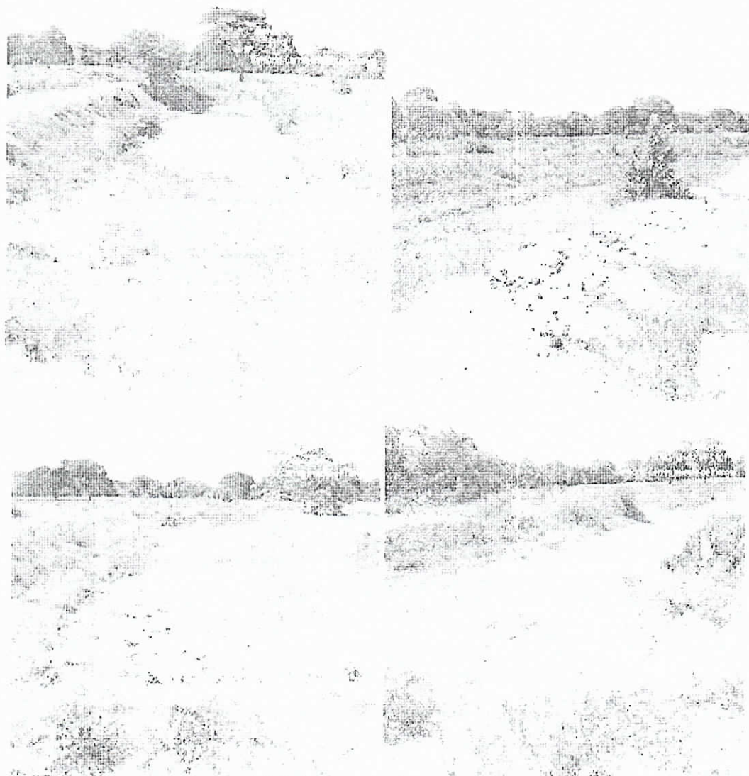
Fotografías 1 – 4. Lagunas de Oxidación Proyectadas. Corregimiento de Mongui. 26 Agosto del 2019.