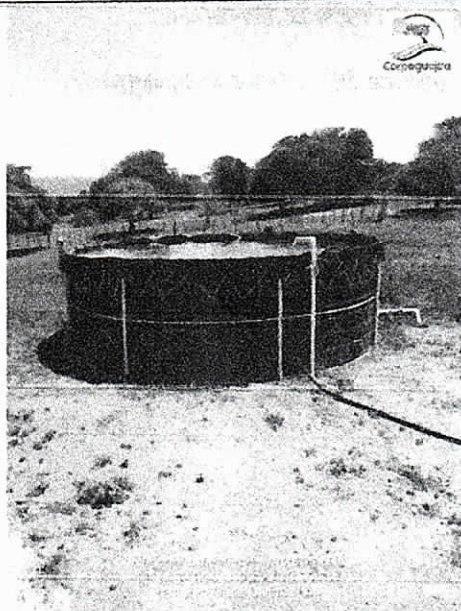
Fotografía 3. Tanque de almacenamiento de agua para el sistema de riego –predio Divino Niño