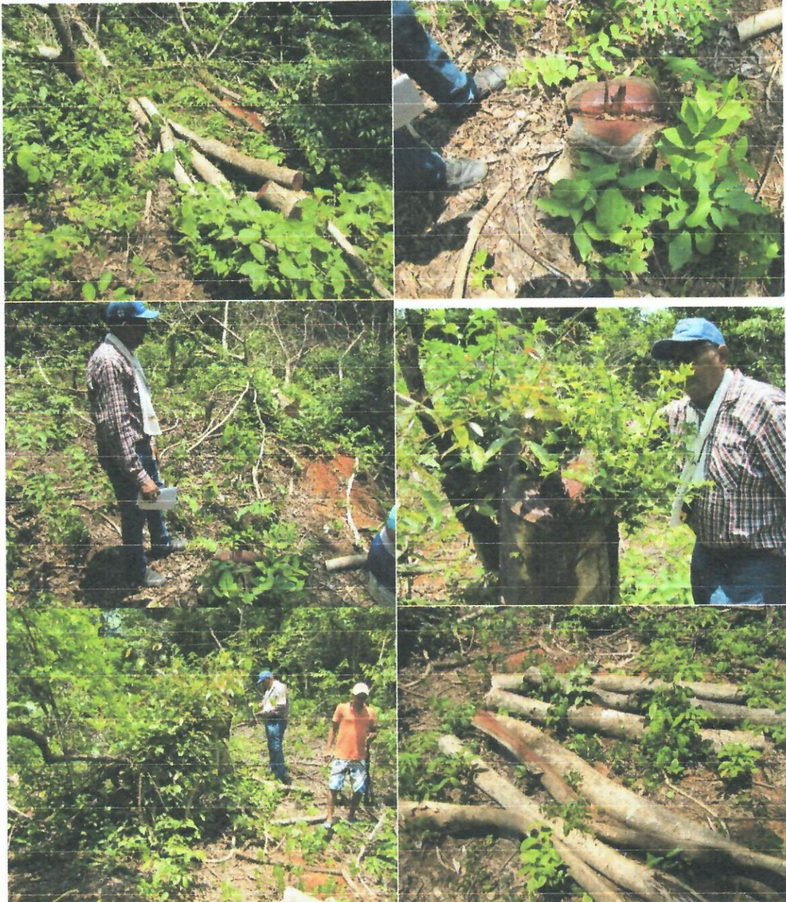
Img. (15 – 20). Vegetación afectada