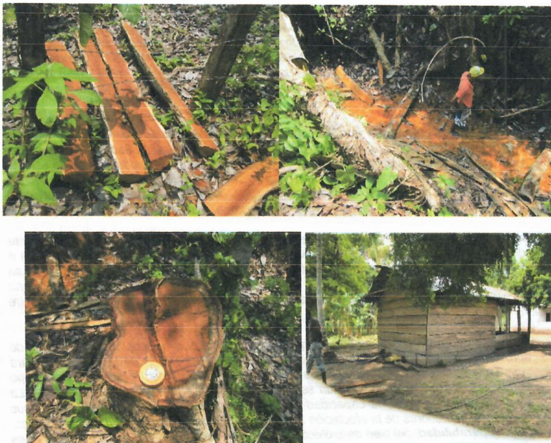
Img. (21 – 26). Vegetación intervenida