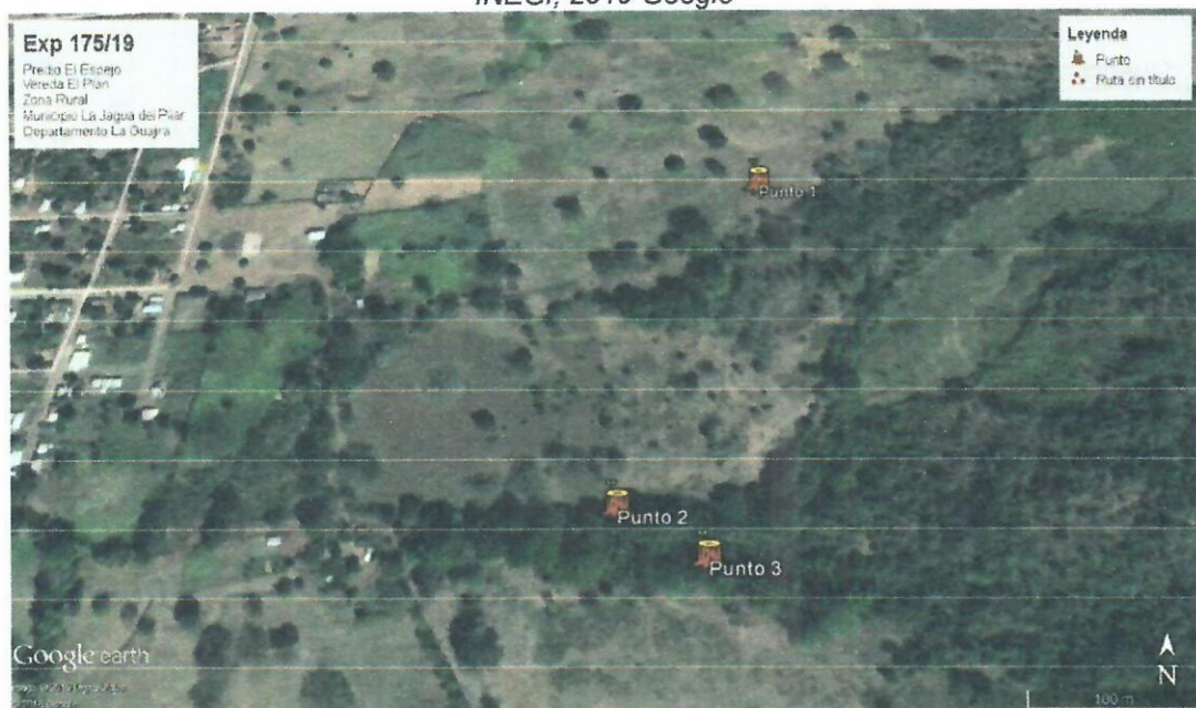
Img. 2. Ubicación satelital de la ruta y zona de interés.