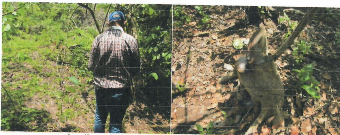
Img (3 – 8). Evidencia de los tocones y la madera adquirida