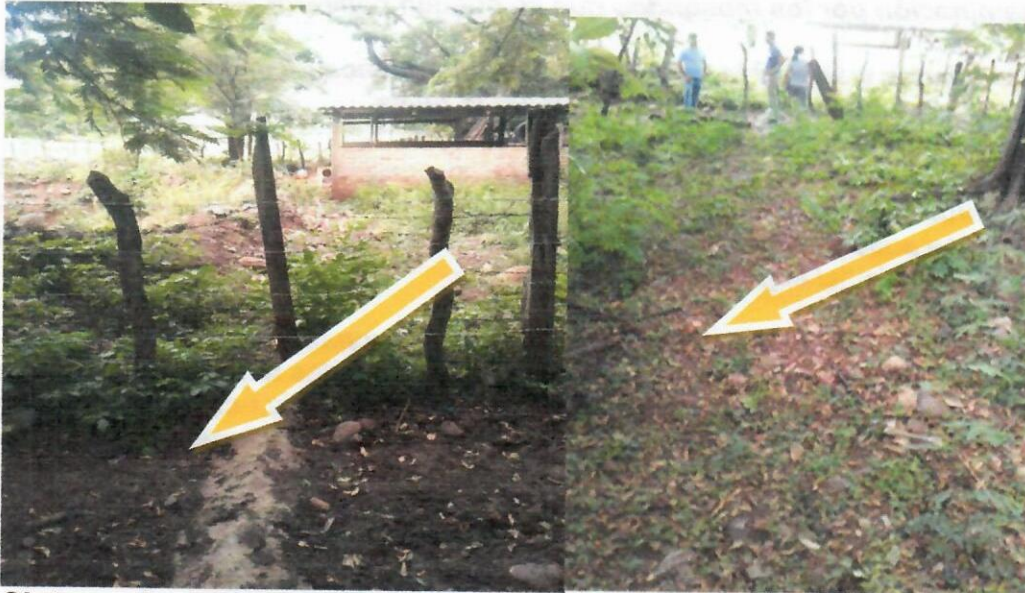
Sistema de tubería o ducto por donde se descarga vertimiento de aguas residuales a la acequia el espinal