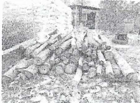
Evidencias del producto acopiado en el Predio Río claro