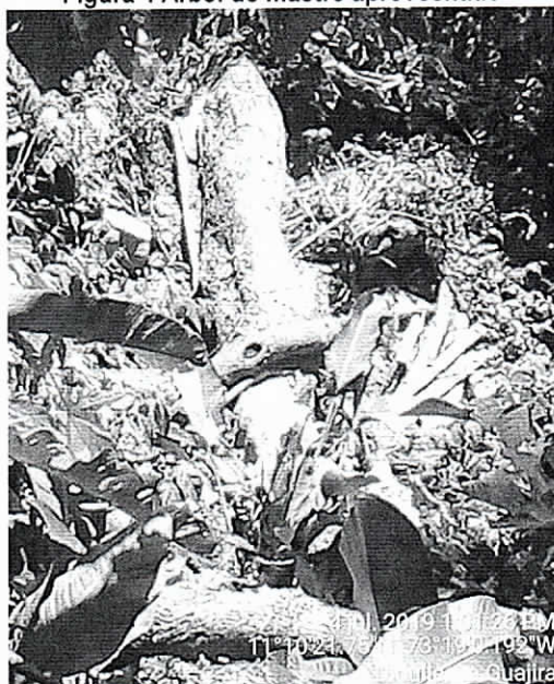
Figura 4 Árbol de mastre aprovechado

Predio La Esperanza, vereda Larga Vida, municipio de Dibulla. 04/07/2019