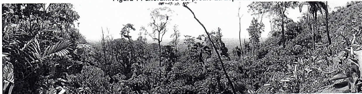
Figura 1 Panorámica del predio La Esperanza

Vereda Larga Vida, municipio de Dibulla. 04/07/2019