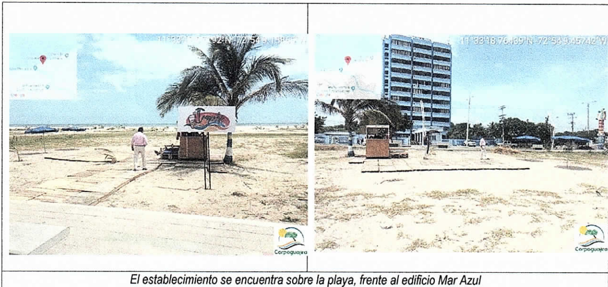
El establecimiento se encuentra sobre la playa, frente al edificio Mar Azul

En recorrido realizado por la playas de Riohacha el día 7 de julio de 2019, más precisamente frente al edificio Mar Azul ubicado sobre la calle primera, pasando el brazo del Riito con dirección noreste, se evidenció el funcionamiento de un establecimiento comercial de nombre "Trapiche Beach" ubicado sobre el área de playa. El establecimiento se encuentra en estibas de madera colocadas sobre la arena, cuenta con una caseta en madera para la venta de "micheladas", bebidas y cocteles, sillas, dos parasoles y dos palmeras recién sembradas pertenecientes a la especie Cocos nucifera; se evidenció además que el establecimiento se encuentra conectado de manera ilegal a la caja de registro eléctrico del alumbrado público y posible remoción de la cobertura vegetal para la ubicación del establecimiento.