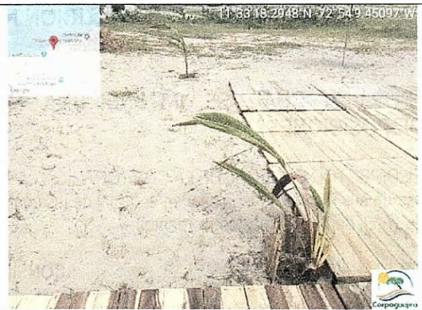
Palmeras (Cocos nucifera) recién sembradas