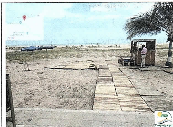
Estibas ubicadas sobre la arena