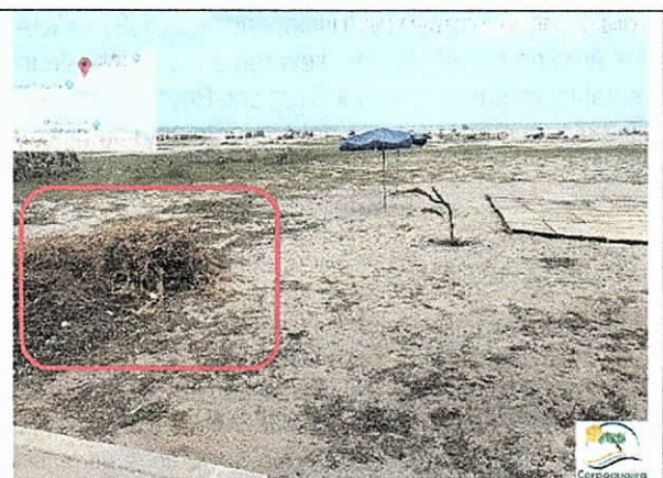
Remoción de la vegetación para la ubicación del establecimiento