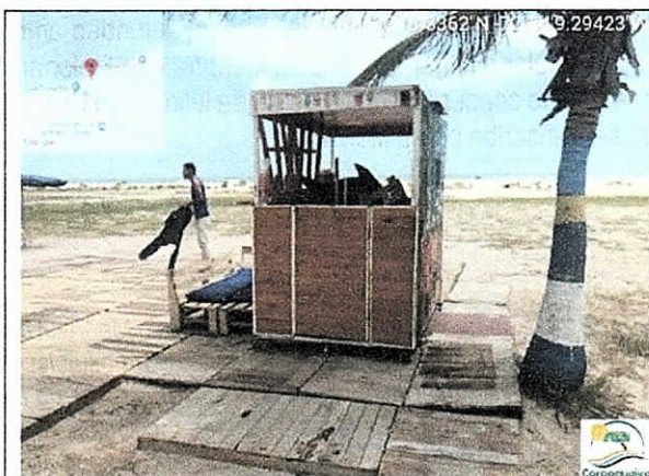
Caseta para preparación y venta de bebidas