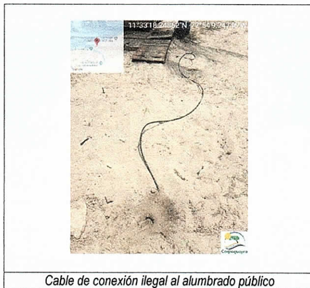
Cable de conexión ilegal al alumbrado público

Posteriormente, el día 22 de julio de 2019 se realizó una visita de inspección ocular en compañía de funcionarios del Grupo de Seguimiento de la Subdirección de Autoridad Ambiental de Corpoguajira, se encontraron pedazos de limones, servilletas y pitillos alrededor del área de las estibas (sobre la arena), instalación de un baño portátil y nuevas estibas, y cerramiento del lugar con estacas de madera y cuerda.