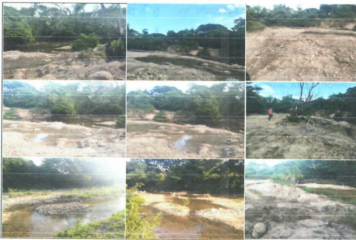
Imagen 1. Evidencias del estado actual del paso los pastelillos, lugar de extracción del material de arrastre para la comercialización.