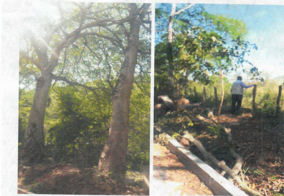
Img.(3-4).arboles con afectaciones en las raíces y funcionario en el sitio de interés