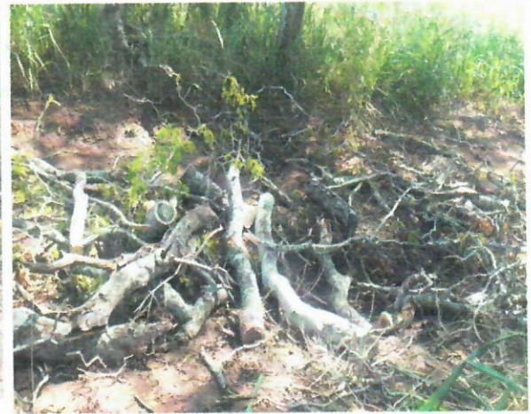
Img.(7-10). Punto donde se encontraba el árbol cuando estaba en pies, lo sacaron de raíz