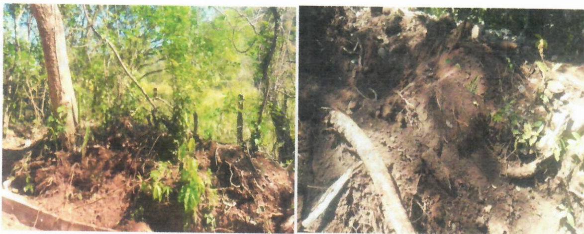
Img. (11-12). Punto donde se encontraba el árbol cuando estaba en pies, lo sacaron de raíz