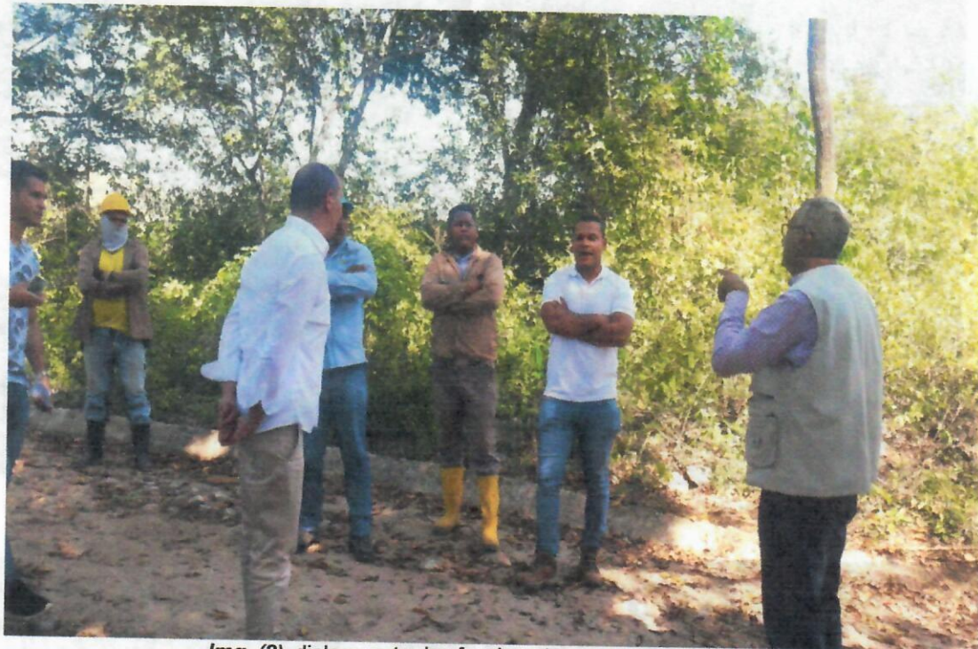
Img. (2). dialogo entre los funcionarios y residente de la obra