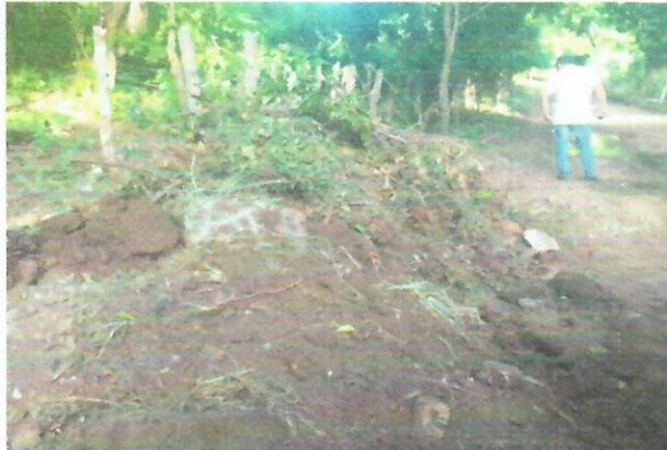
Imagen 3. punto Intervenido Remoción de vegetación 10°33'10.48"N - 72°59'46.01"O