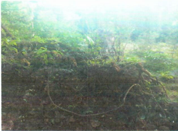
Imagen 1. punto Intervenido Remoción de vegetación 10°33'13.02"N - 73° 0'6.07"O