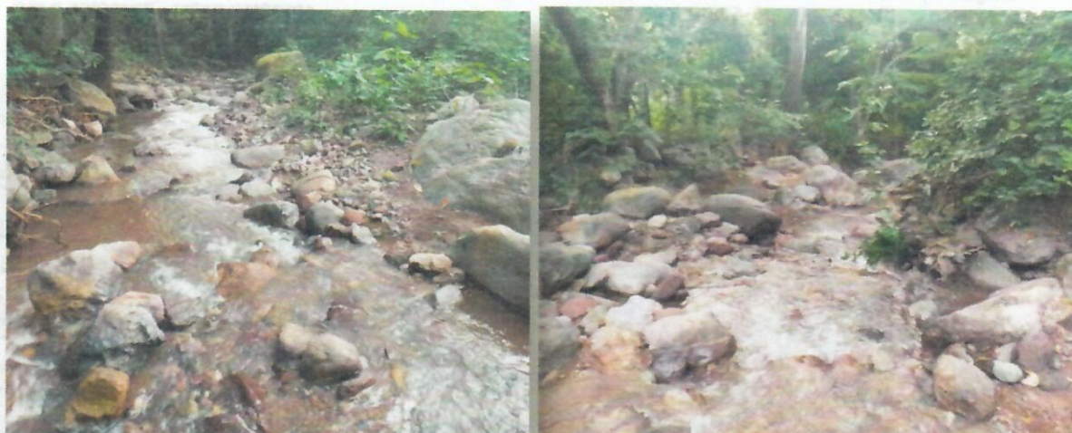
Imagen 3. Sitio a intervenir para la construcción de una depresión, punto 3, Arroyo