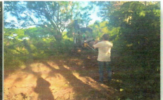
Imagen 8. punto Intervenido Remoción de vegetación Coord. Geo. 10°33'1.08"N - 72°59'22.26"O