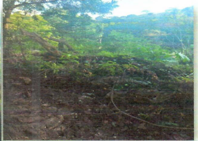
Imagen 2. Punto Intervenido Remoción de vegetación 10°33'13.95"N - 72°59'55.84"O