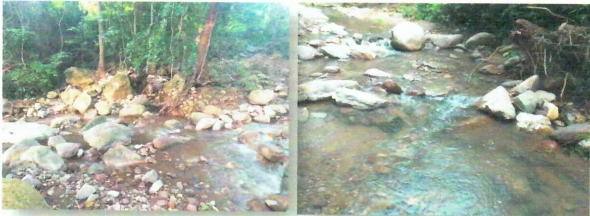
Imagen 1. Sitio a intervenir para la construcción de una depresión, punto 1, Arroyo

Registro fotográfico 2: Estado actual de los puntos de ocupación de cauce que pretenden intervenir sin el respectivo permiso de CORPOGUAJIRA.