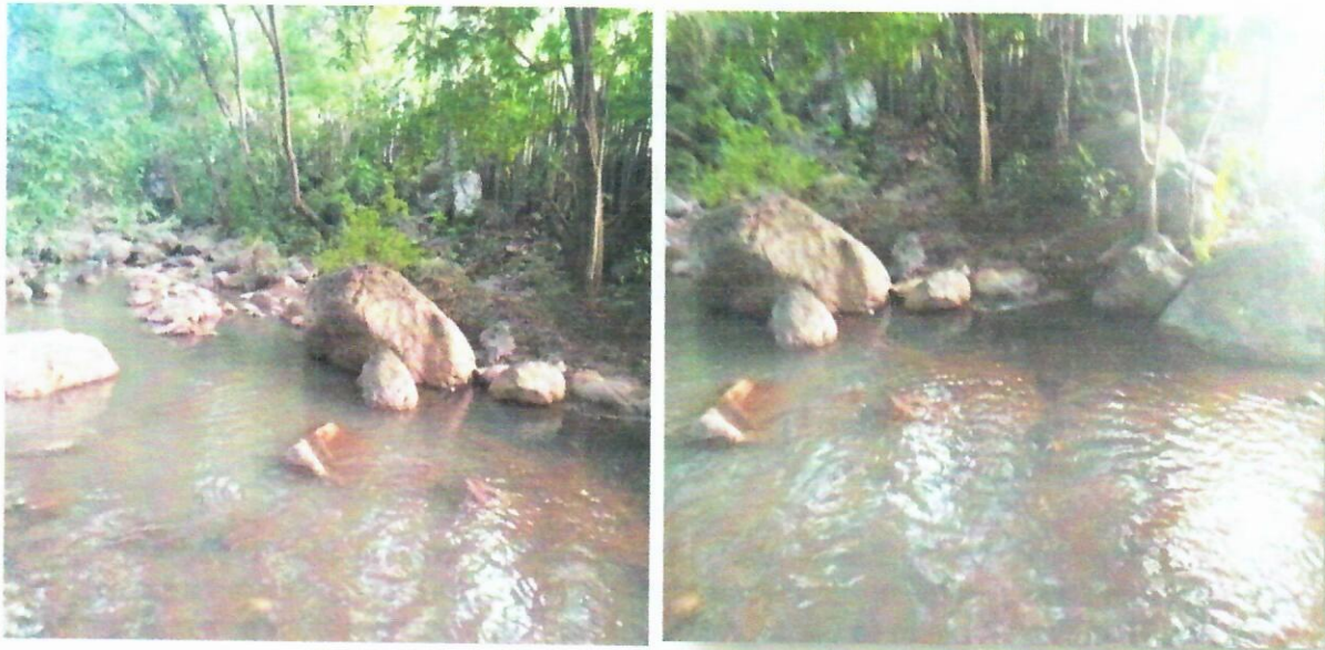
Imagen 2. Sitio a intervenir para la construcción de una depresión, punto 2, Arroyo