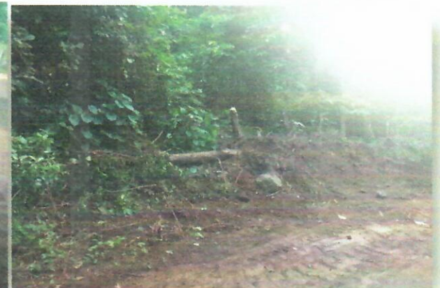
Imagen 4. Punto Intervenido Remoción de vegetación 10°33'9.08"N - 72°59'40.91"O