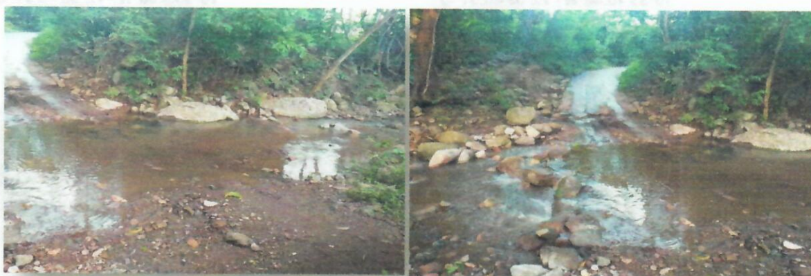
Imagen 4. Sitio a intervenir para la construcción de una depresión, punto 4, Arroyo