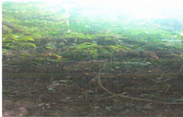
Imagen 5. punto Intervenido Remoción de vegetación 10°33'9.08"N - 72°59'40.91"O