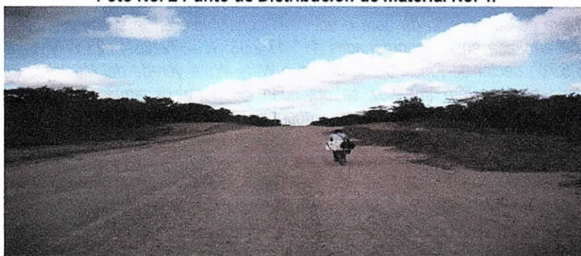
Foto No. 2 Punto de Distribución de material No. 1.