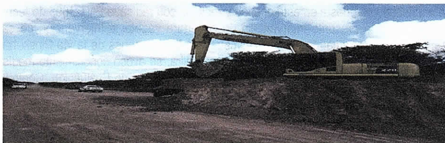
Foto No.1 Retroexcavadora realizando movimiento de tierras

El sitio de movimiento de tierra con el empleo de una Retroexcavadora se identificó con la coordenada geográfica (WGS 84) 11^{\circ}17'04.4'' N y 72^{\circ}28'47.2'' W; del cual se fija la siguiente evidencia: