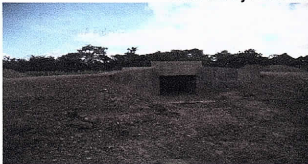
Fotos No. 6 y 7 Box Culvert y rectificación de cauce

Concluida la conversación con las personas antes mencionadas, se tomó registro de uno Box Culvert, en el cual se evidencia la prolongación en la rectificación del cauce con maquinaria, la cual es superior a 100 metros de longitud y en la que hubo intervención de cobertura en ambas márgenes, este Box Culvert se identifica con las coordenadas 11°19'3.0" N y 72°32'46.2" W.