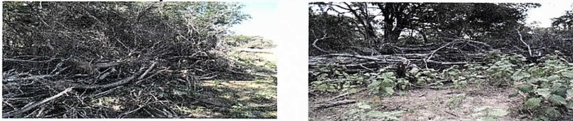
Fotos No. 8 y 9 Evidencia de intervención de cobertura acumulada sobre la vía.

Finalmente se tomó registro fotográfico de la cobertura vegetal intervenida a lo largo de los 9.4 kilómetros aproximadamente de longitud de mejoramiento de vía, la cual continua depositada sobre la cobertura actual del bosque natural.