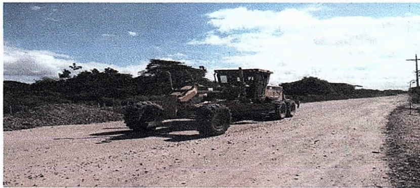
Foto No. 5 Motoniveladora sobre la vía.