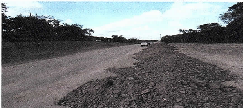
Foto No. 3 Punto de Distribución de material No. 2.