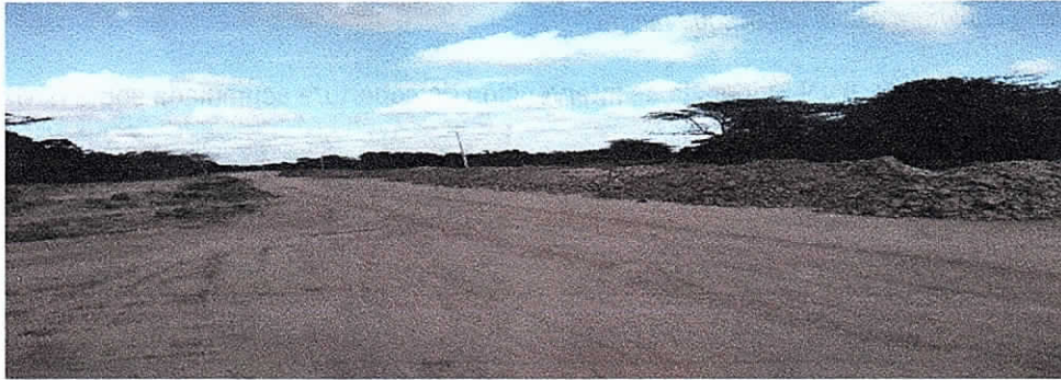
Foto No. 4 Punto de Distribución de material No. 3.