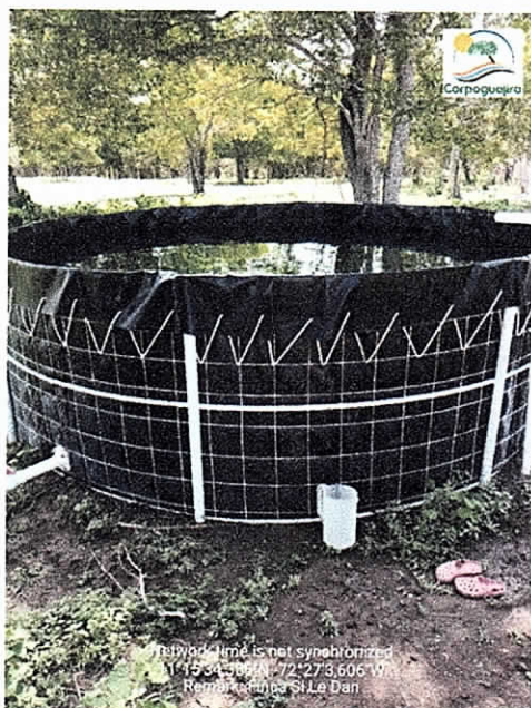
Fotografía 3. Tanque de almacenamiento de agua para el sistema de riego –predio Si le Dan