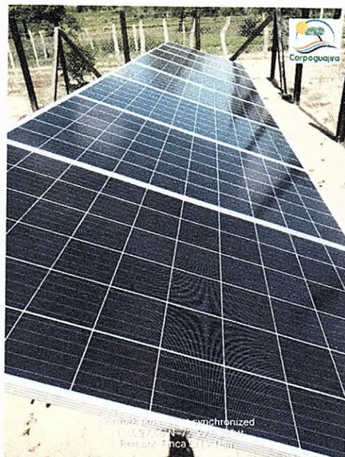
Fotografía 2. Paneles solares – Pozo Si le Dan