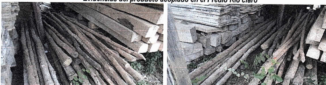
Evidencias del producto acopiado en el Predio Río claro