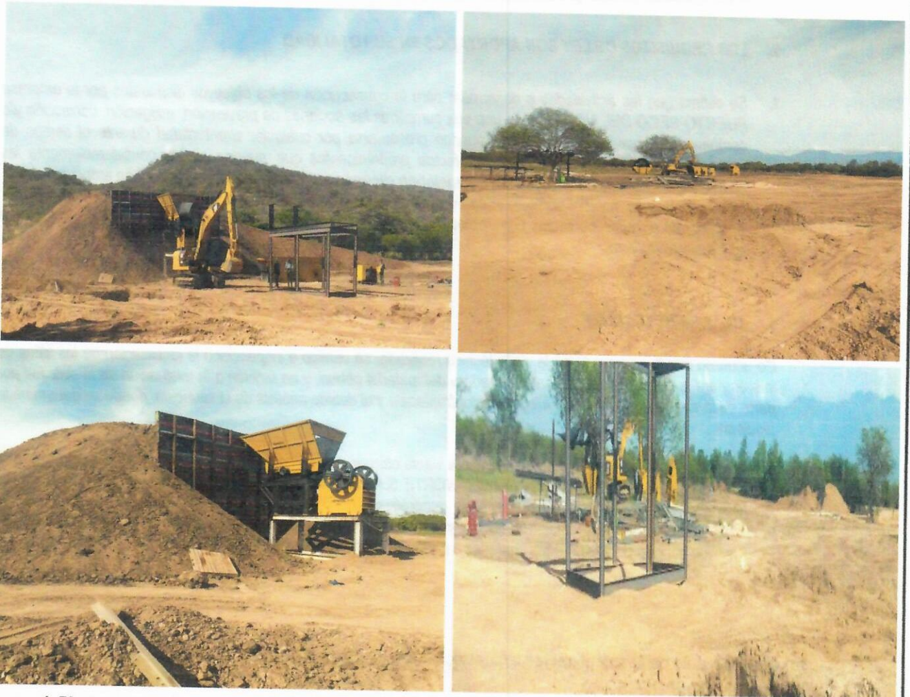
Imagen 1. Planta procesadora y maquinarias empleadas en la trituración de la materia prima para la obtención de materiales de construcción.