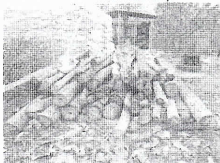
Evidencias del producto acopiado en el Predio Río claro