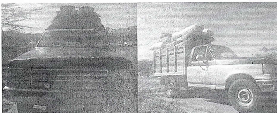
Se evidencia la placa del vehículo (RO9364)

NOTA. En el momento del decomiso la Autoridad Ambiental no contaba con acta única de control al tráfico ilegal de flora y fauna silvestre, dado que por inexistencia de las mismas, se había solicitado al MADS, nuevos consecutivos para proceder a cotizar impresión de los nuevos seriales adjudicados; por tal razón quedaron algunos decomisos sin entregarse formalmente en la Subdirección de Autoridad Ambiental y Secretaría General para los trámites pertinentes pero el funcionario de logística estaba enterado del decomiso para lo de su interés.