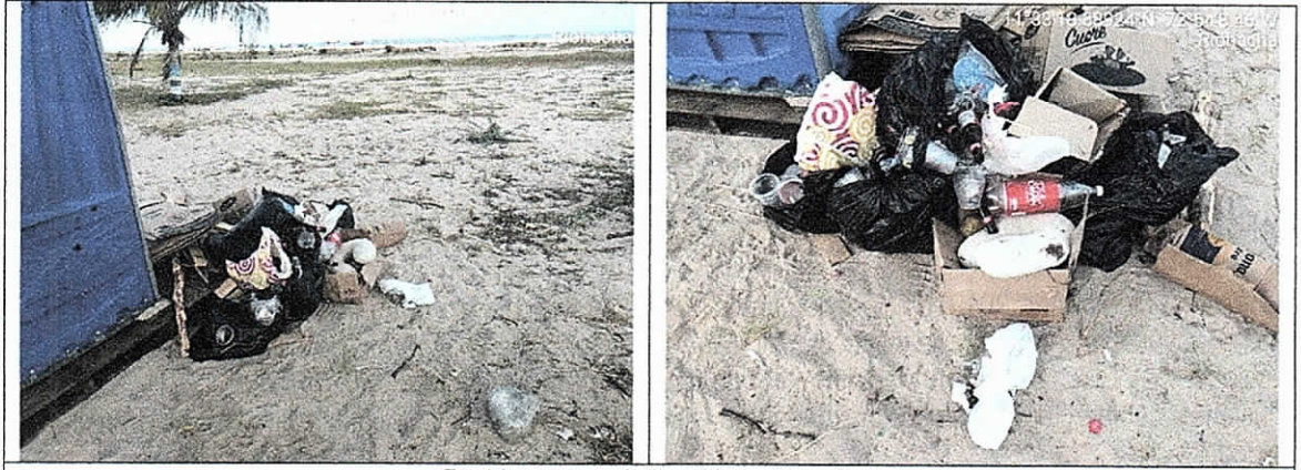
Residuos acumulados al lado del baño

Durante la inspección se observaron impactos sobre el ecosistema de playa, el más evidente es el mal manejo de residuos sólidos como lo encontrado al lado del baño portátil en donde se encontró una acumulación de todo tipo de residuos; tanto dentro del área del establecimiento como a su alrededor se evidenciaron residuos sólidos como pedazos de vidrio, botellas de vidrio, plásticos en diferentes presentaciones, papel, los cuales permanecen por la falta de aseo y por la mala disposición que sumada a la acción del viento hace que se disperse por toda el área de playa causando contaminación al sustrato arenoso y paisaje.