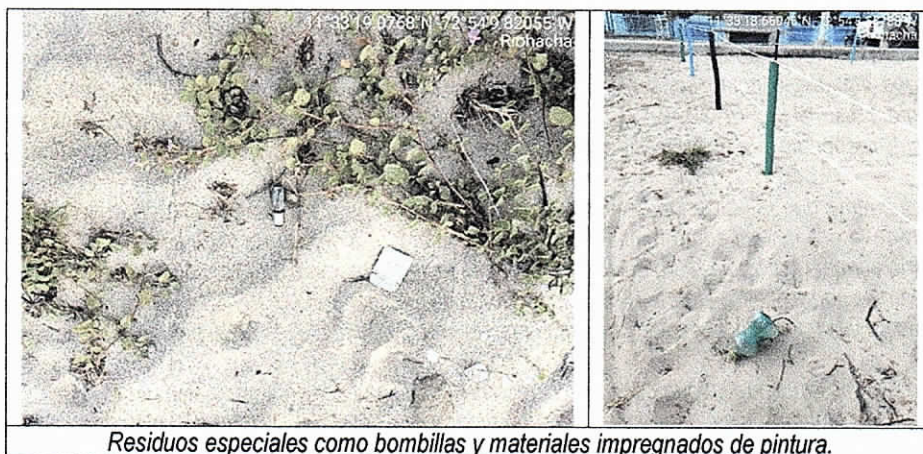
Residuos especiales como bombillas y materiales impregnados de pintura.

Otras de las afectaciones evidenciadas fueron la remoción de la vegetación presente en el sustrato de la playa, el uso de las palmeras como base colocar las toma corrientes clavando puntillas en ellas y la falta de disposición final del material vegetal removido tanto del sustrato como de las palmeras.