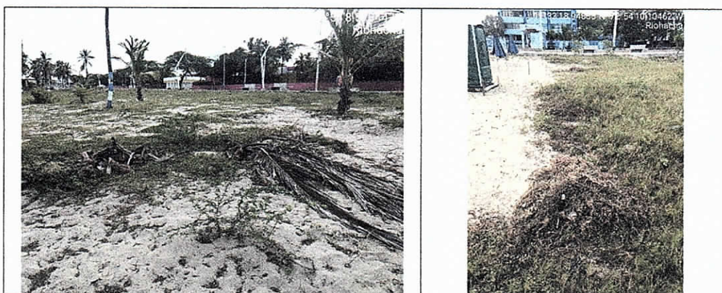
Acumulación y disposición final indebida del material vegetal cortado, en las zonas aledañas al establecimiento WAYA COCO BEACH.

Otras de las afectaciones evidenciadas fueron la remoción de la vegetación presente en el sustrato de la playa, el uso de las palmeras como base colocar las toma corrientes clavando puntillas en ellas y la falta de disposición final del material vegetal removido tanto del sustrato como de las palmeras.