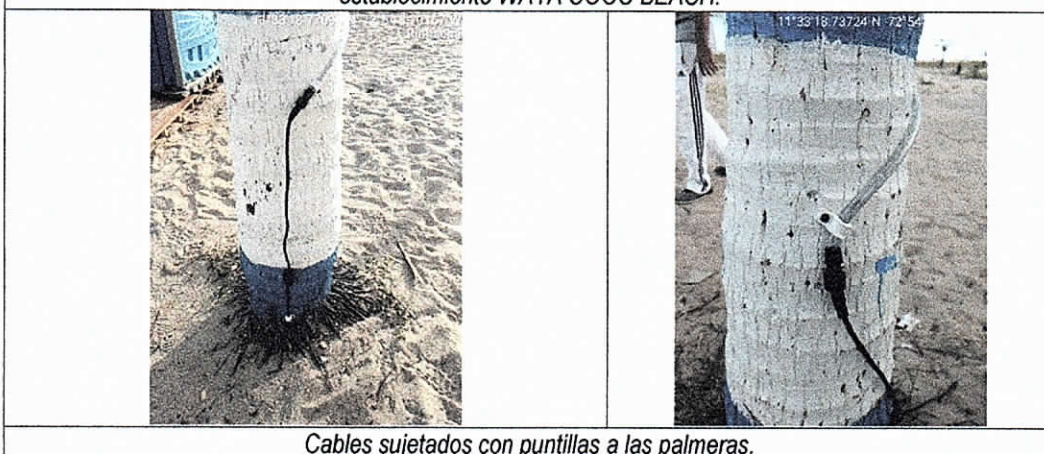
Cables sujetos con puntillas a las palmeras.