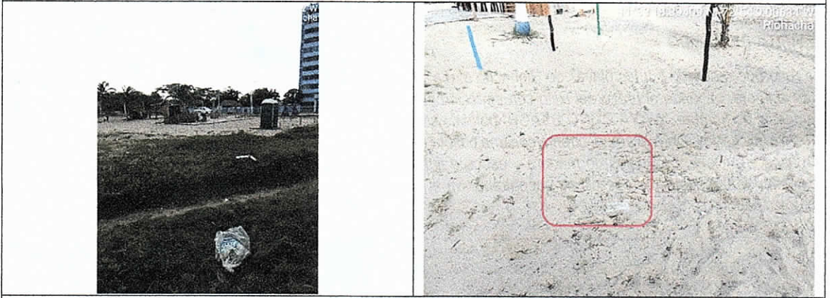
Residuos dispersos alrededor de los establecimientos TAPICHE BEACH y WAYA COCO BEACH