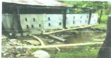
Vertimiento de aguas residuales a la acequia PENSO