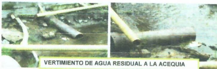
VERTIMIENTO DE AGUA RESIDUAL A LA ACEQUIA