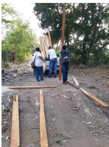
Fig. 16. Carga de las 21 piezas de madera semielaborada