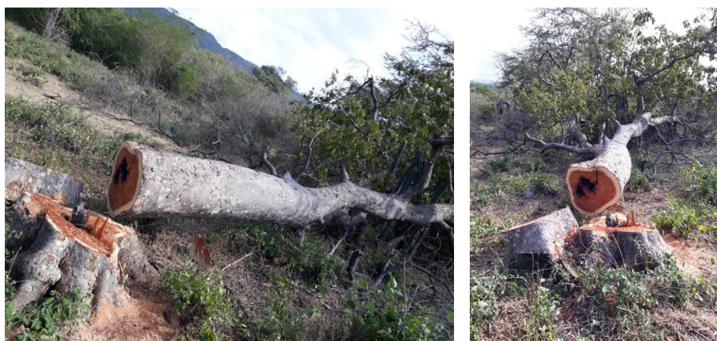
Fig. (5-6). Individuo arbóreo de la especie Quebracho ( Astronium graveolens )