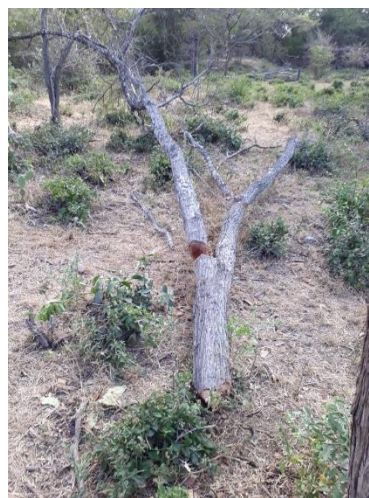
Fig. (11 – 13). Individuo arboreo cinco de la especie Trupillo ( Prosopis juliflora )