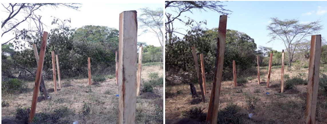
Fig. (14-15). 12 Bloques de Madera semielaborada de la especie Carreto ( Aspidosperma polyneuron )