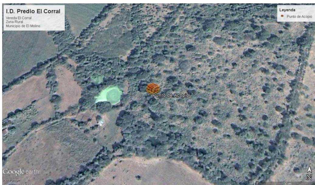
Fig. 2. Ubicación satelital del punto de Acopio y zona de interés.