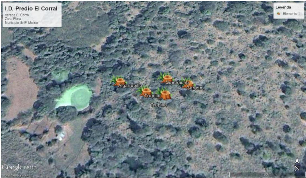
Fig. 1. Ubicación satelital de la ruta y zona de interés.

La madera que fue decomisada de aquella afectación fueron las veintiún (21) piezas correspondiente a las diecinueve (19) varetas y los dos (02) bloques de la especie Carreto ( Aspidosperma polyneuron ) puesto que por la disponibilidad de espacio en el vehículo de la Corporación tan solo se pudieron cargar el número de piezas ya mencionadas anteriormente, las cuales poseen un volumen aproximado de 0,354 m³ .