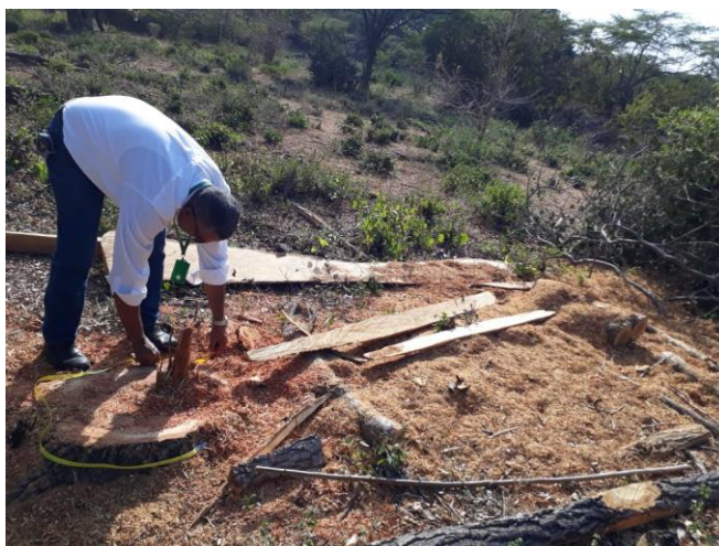
Fig. (7-8). Individuo arbóreo de la especie Carreto ( Aspidosperma polyneuron )