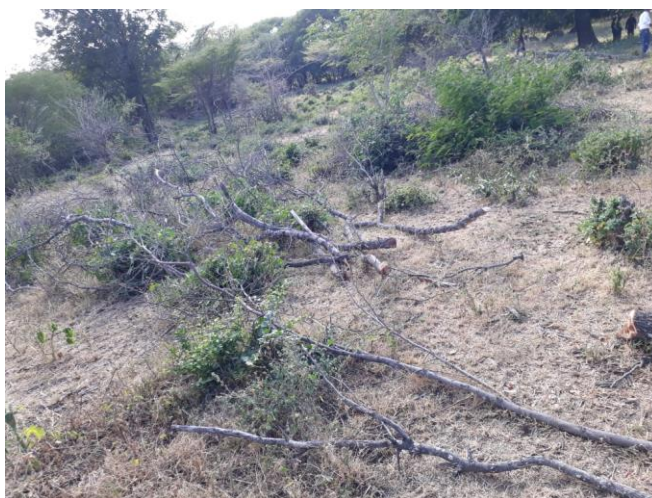
Fig. (9-10). Individuo arboreo de la especie Trupillo ( Prosopis juliflora )