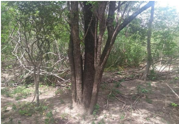
Foto 13. Árbol de Sajarito en pie