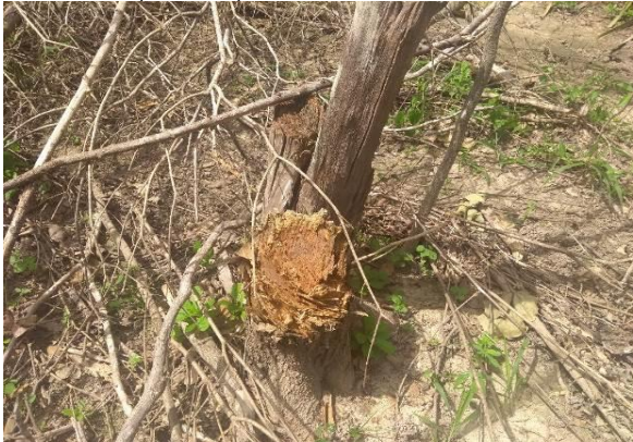
Foto 4. Tala árbol seco