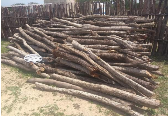
Foto 3. Puntales vistos desde otro Angulo