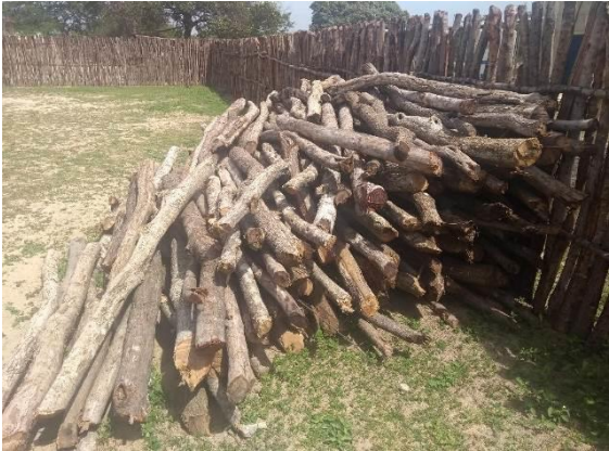
FOTO 2. EVIDENCIA DE LOS 300 PUNTALES