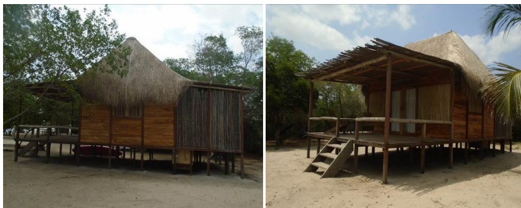
Figura 9. Cabañas en áreas de playa y de la laguna de Mamavita.

En este sector de la desembocadura de la laguna de Mamavita, se evidencio que las cabañas se identifican con nombres de aves (Chorlitos, Pelicanos, Ibis), el baño presenta dibujadas en las paredes varias especies de aves acuáticas y se observa que el vertimiento drena hacia el cuerpo de agua de la laguna de Mamavita, todas las cabañas y demás infraestructuras fueron construidas en madera a estilo palafito como se evidencia en los registros fotográficos.