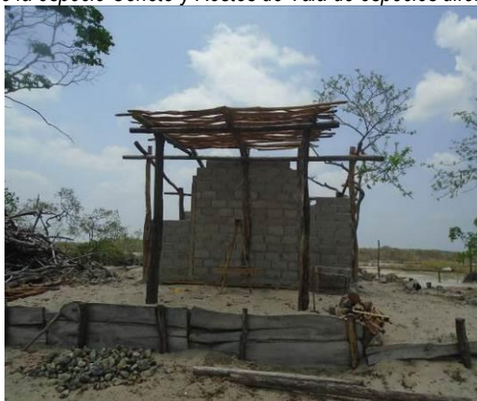
Figura 4. Construcción de baños.