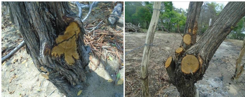
Figura 1. Intervención del manglar especie conocarpus por poda manual utilizando motosierra.