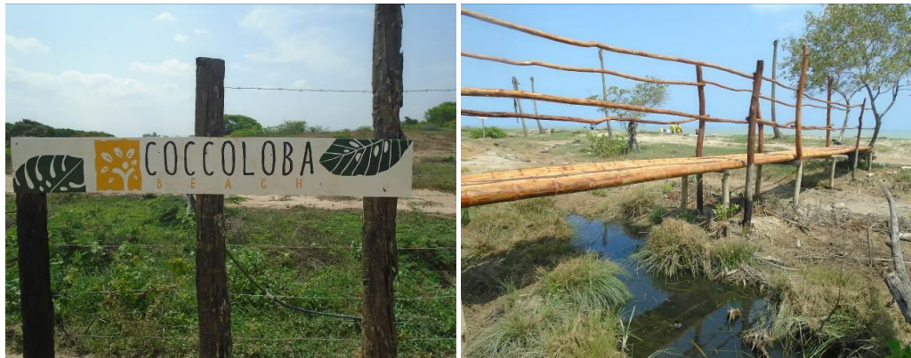
Figura 5. Nombre del Hotel y Puente en madera utilizando varas de mangle y otras

Este caso no se argumentó detalladamente, sin embargo, se tonaron evidencias de construcciones y utilización de madera (Varas) 14 de 0,04 m x 3m de mangle amarillo ( Laguncularia racemosa ), 7 postes de Puy ( Handroanthus billbergii ) de 0,10m x 3 m.