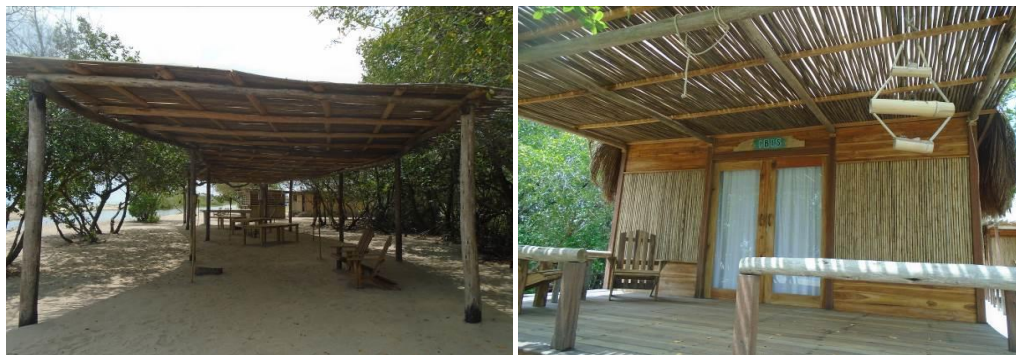
Figura 8. Enramadas y alojamientos en área de la laguna Mamavita.