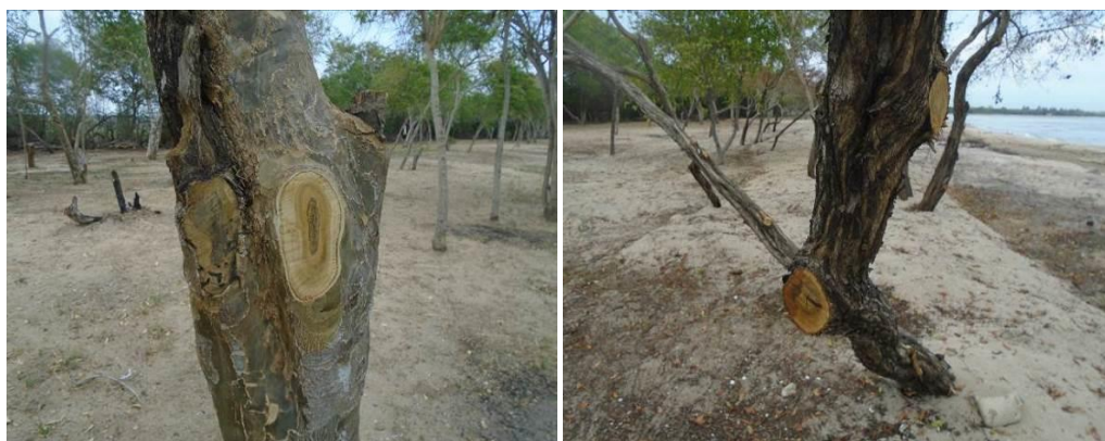
Figura 2. Poda en mangle conocarpus y otras especies del bosque natural.