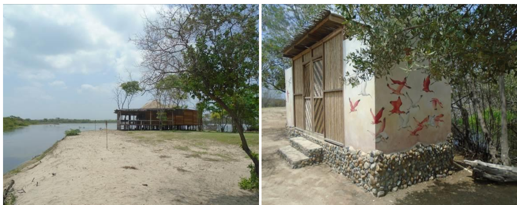
Figura 7. Construcciones y baños que drenan a la laguna Mamavita.