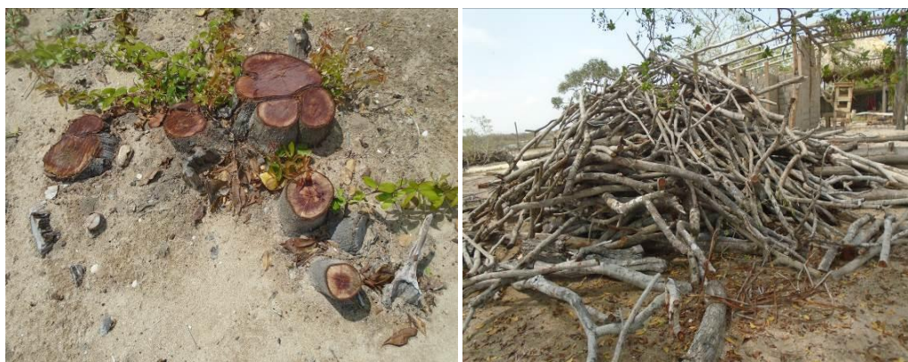
Figura 3. Tala de la especie Corioto y Restos de Tala de especies diferentes al mangle.