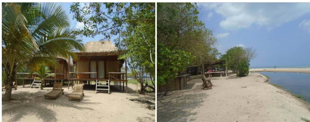
Figura 6. Construcción en área de manglar y construcciones en la desembocadura de la laguna.