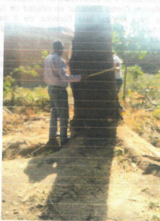
Img. (2-3). Árbol de la especie Orejero ( Enterolobium cyclocarpum )