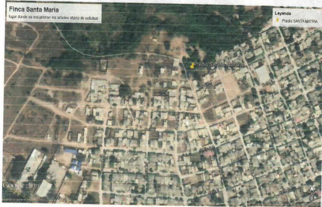
Img. 1. Ubicación satelital de la ruta de interés.