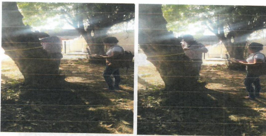
Img. (4-5). árboles de la especie Mataratón ( Gliricidia sepium )