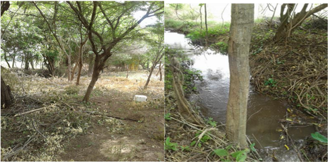
Fig.1-2. Individuos Arboreos de la especie Mulato ( Lysiloma acapulcensis ) – Predio la Cecilia dentro de Franja de Portecccion.