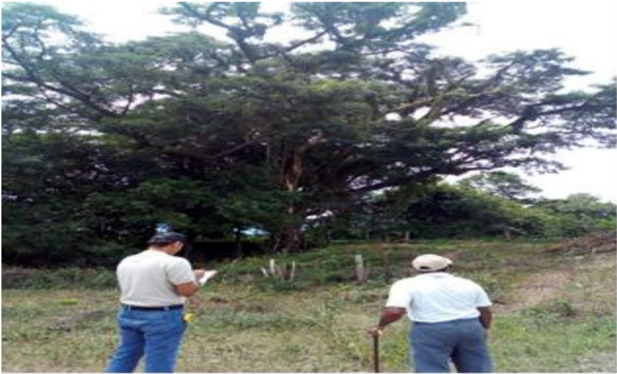
Fig.3. Individuo Arboreo de la especie algarrobligo ( Prosopis affinis )