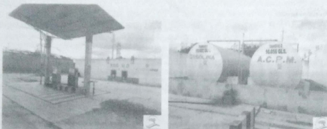
Fotografías No. 1 - 2: Área de despacho y área de almacenamiento de combustible. ESTACIÓN DE SERVICIO H.O. 13 de noviembre de 2019.

3.1.1. VENTA DE COMBUSTIBLE: La ESTACIÓN DE SERVICIO H.O se realiza el acopio y expendio de combustibles (ACPM) por medio dos surtidores ubicados en la isla de despacho. El almacenamiento de este combustible se realiza por medio de dos tanques individuales superficiales ubicados en el patio de EDS, para ACPM con capacidades de 10.022 y 10.056 galones respectivamente.