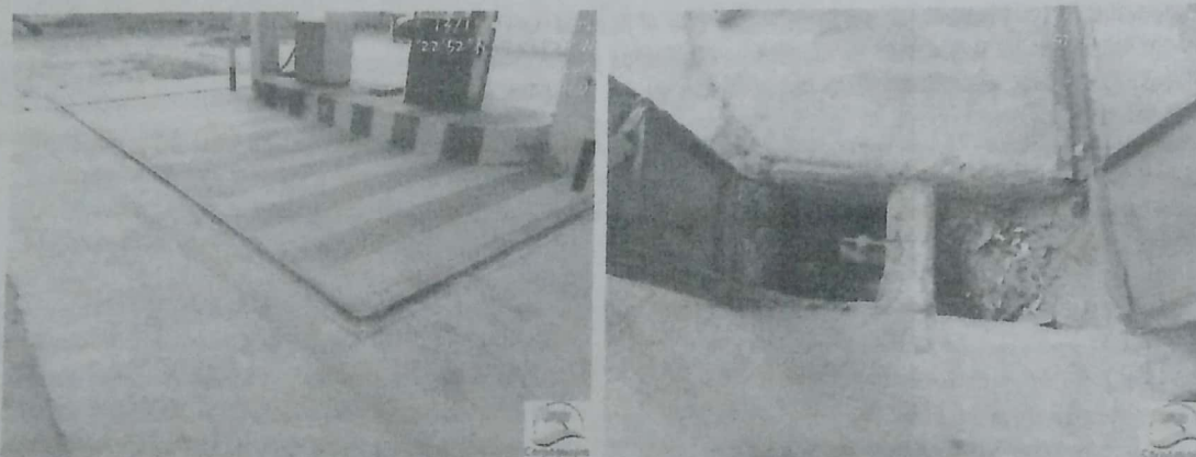
Fotografías No. 7 - 8: Canal perimetral y cajilla de recolectora. ESTACIÓN DE SERVICIO H.O. 13 de noviembre de 2019. (Fuente CORPOGUAJIRA).

3.2.4 TRATAMIENTO PRIMARIO DE AGUAS NO DOMÉSTICAS: Las aguas no domésticas que se generan en la EDS provienen de la isla de despacho y la cajilla recolectora del sistema de contención de los tanques de combustibles. Para el primer caso, la EDS cuenta con un canal perimetral que conduce las aguas hacia una cajilla ubicada en la esquina del canal para su recolección. En la visita se observó la falta de mantenimiento de dicha cajilla, dicho sistema tenía gran cantidad de residuos ordinarios. No obstante, lo anterior, no presentaron actas de recolección tratamiento y/o disposición final con una empresa especial que disponga estos residuos adecuadamente. En la cajilla recolectora del sistema de contención de los tanques de combustibles se observó falta de mantenimiento, debido a que dicho sistema tenía gran cantidad de agua aceitosas y alrededor de esta una mancha oscura proveniente de hidrocarburos.