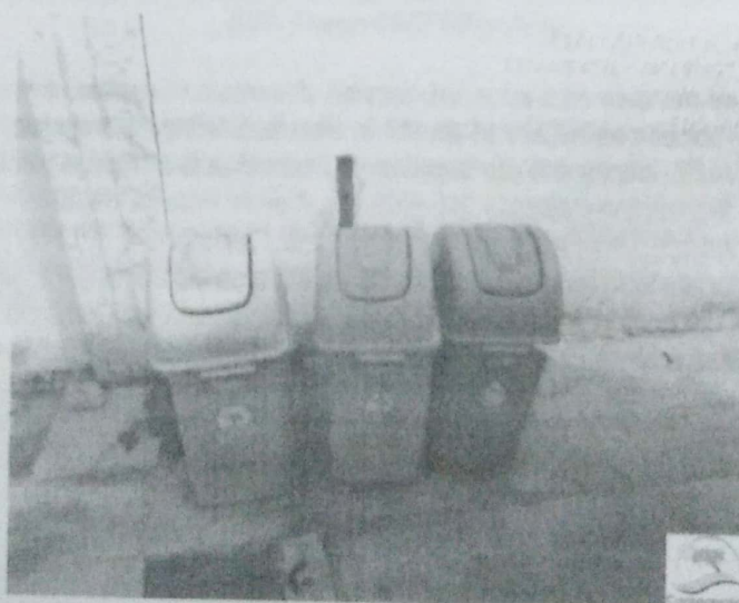
Fotografía No. 3: Contenedores para el almacenamiento temporal de residuos sólidos. ESTACIÓN DE SERVICIO H.O. 13 de noviembre de 2019.

3.2.1 MANEJO DE RESIDUOS SÓLIDOS ORDINARIOS Y APROVECHABLES: En la ESTACIÓN DE SERVICIO H.O. se evidenció tres contenedores codificados con colores donde se realiza el almacenamiento temporal de los residuos, son presentarlos a la empresa prestadora del servicio de aseo en el municipio de Maicao, (ASEO TÉCNICO S.A.S. E.S.P.) para su disposición final. Sin embargo, se evidenció el manejo inadecuado de dichos residuos, debido a que los mezclan; causando impacto ambiental porque aumenta el volumen de los residuos que llegan a disposición final, al adicionarse los que tiene valor económico y no se puede aprovechar por estar contaminados con los residuos ordinarios.