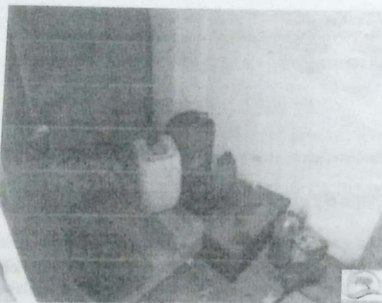
Fotografías No. 4: Almacenamiento de residuos peligrosos. ESTACIÓN DE SERVICIO H.O. 13 de noviembre de 2019.

La responsabilidad del generador subsiste, hasta que el residuo peligroso sea aprovechado como insumo o dispuesto finalmente en depósitos o sistemas técnicamente diseñados y no represente riesgo para la salud humana y el ambiente, tal como lo establece, el Decreto 1076 del 2015, en su Art. 2.2.6.1.3.3, por lo cual, el establecimiento debe gestionar estos residuos con organismos o entidades que cuenten con las licencias, permisos, autorizaciones o demás instrumentos de manejo y control ambiental a que haya lugar.