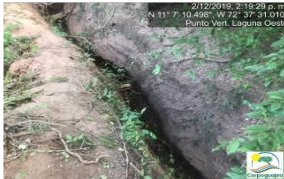
Fotografías No. 31 y 32. Aguas estancadas e infiltradas en el suelo en el canal de vertimiento de la Laguna Oeste. CARBONES DEL CERREJON LIMITED – CERREJON. COMPLEJO MINA. 02 de diciembre de 2019. (Fuente: Corpoguajira 2019).