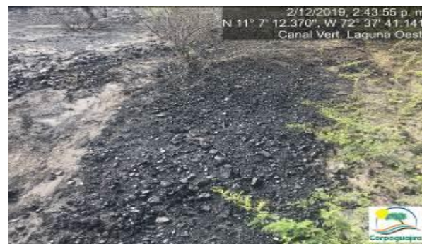
Fotografías No. 17 y 18. Mineral de carbón sedimentado en el canal de vertimiento de la Laguna Oeste. CARBONES DEL CERREJON LIMITED – CERREJON. COMPLEJO MINA. 02 de diciembre de 2019. (Fuente: Corpoguajira 2019).