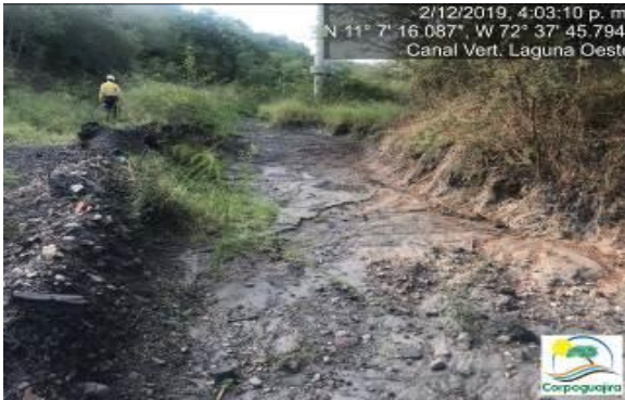
Fotografías No. 3 y 4. Estado del canal de vertimiento de la Laguna Oeste. CARBONES DEL CERREJON LIMITED – CERREJON. COMPLEJO MINA. 02 de diciembre de 2019.