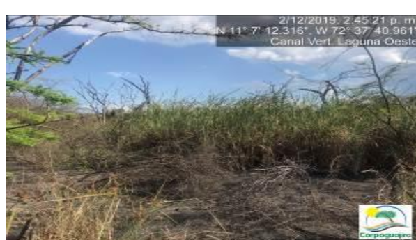
Fotografías No. 15 y 16. Mineral de carbón sedimentado en el canal de vertimiento de la Laguna Oeste. CARBONES DEL CERREJON LIMITED – CERREJON. COMPLEJO MINA. 02 de diciembre de 2019.