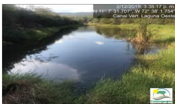
Fotografías No. 13 y 14. Aguas estancadas e infiltradas en el suelo en el canal de vertimiento de la Laguna Oeste. CARBONES DEL CERREJON LIMITED – CERREJON. COMPLEJO MINA. 02 de diciembre de 2019.