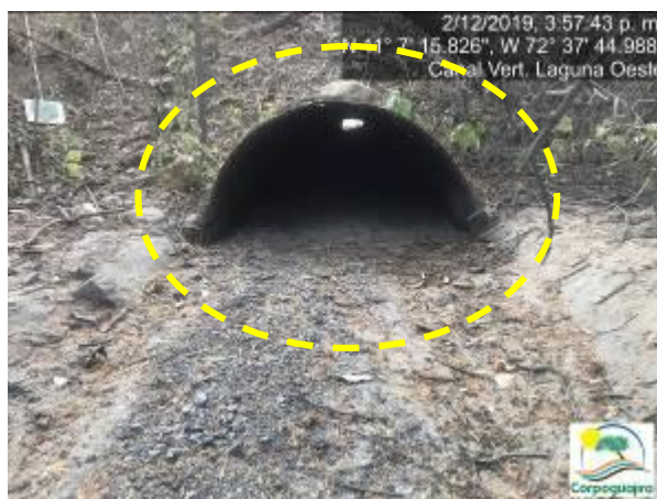
Fotografías No. 11 y 12. Alcantarillas utilizadas para el transporte de las aguas en el canal de vertimiento de la Laguna Oeste. CARBONES DEL CERREJON LIMITED – CERREJON. COMPLEJO MINA. 02 de diciembre de 2019.