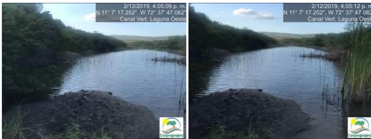
Fotografías No. 1 y 2. Estado de la Laguna Oeste. CARBONES DEL CERREJON LIMITED – CERREJON. COMPLEJO MINA. 02 de diciembre de 2019.

Se requirió a los funcionarios de la empresa CERREJON información sobre estas aguas a lo cual no se obtuvo una respuesta concreta y segura de las aguas que estaban siendo vertidas a la Laguna Oeste, por consiguiente, se manifiesta que ni los mismos funcionarios de la empresa tienen el conocimiento de la procedencia de estas aguas y por lo cual se presume que es un vertimiento ilegal.