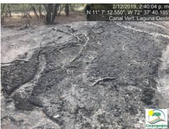
Fotografías No. 25 y 26. Mineral de carbón sedimentado en el canal de vertimiento de la Laguna Oeste. CARBONES DEL CERREJON LIMITED – CERREJON. COMPLEJO MINA. 02 de diciembre de 2019.