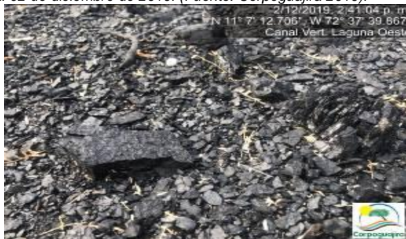
Fotografías No. 21 y 22. Mineral de carbón sedimentado en el canal de vertimiento de la Laguna Oeste. CARBONES DEL CERREJON LIMITED – CERREJON. COMPLEJO MINA. 02 de diciembre de 2019.