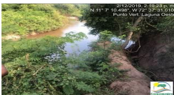
Fotografías No. 33 y 34. Punto de vertimiento de la Laguna Oeste al cauce del río ranchería. CARBONES DEL CERREJON LIMITED – CERREJON. COMPLEJO MINA. 02 de diciembre de 2019.