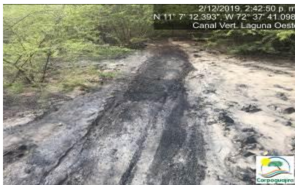
Fotografías No. 19 y 20. Mineral de carbón sedimentado en el canal de vertimiento de la Laguna Oeste. CARBONES DEL CERREJON LIMITED – CERREJON. COMPLEJO MINA. 02 de diciembre de 2019.