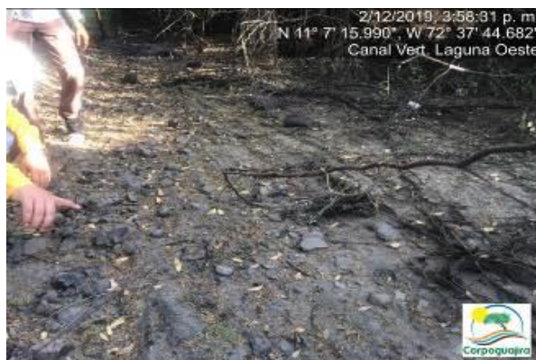
Fotografías No. 9 y 10. Mineral de carbón sedimentado en el canal de vertimiento de la Laguna Oeste. CARBONES DEL CERREJON LIMITED – CERREJON. COMPLEJO MINA. 02 de diciembre de 2019.