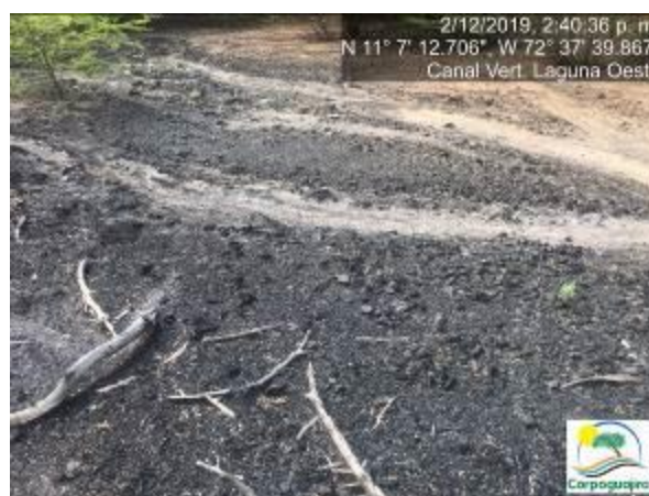
Fotografías No. 23 y 24. Mineral de carbón sedimentado en el canal de vertimiento de la Laguna Oeste. CARBONES DEL CERREJON LIMITED – CERREJON. COMPLEJO MINA. 02 de diciembre de 2019. (Fuente: Corpoguajira 2019).