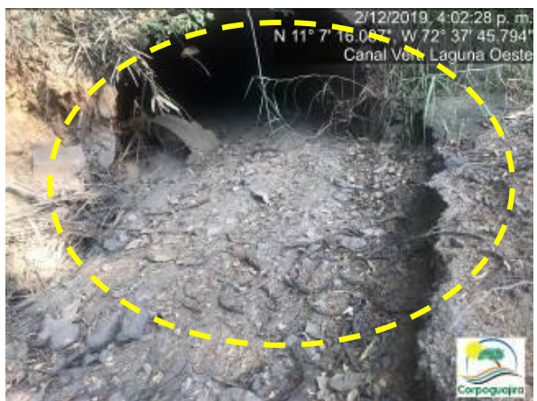
Fotografías No. 7 y 8. Estado del canal de vertimiento de la Laguna Oeste. CARBONES DEL CERREJON LIMITED – CERREJON. COMPLEJO MINA. 02 de diciembre de 2019.