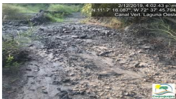
Fotografías No. 5 y 6. Estado del canal de vertimiento de la Laguna Oeste. CARBONES DEL CERREJON LIMITED – CERREJON. COMPLEJO MINA. 02 de diciembre de 2019.