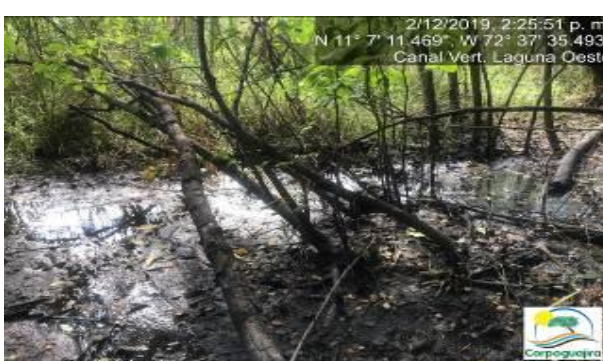
Fotografías No. 29 y 30. Aguas estancadas e infiltradas en el suelo en el canal de vertimiento de la Laguna Oeste. CARBONES DEL CERREJON LIMITED – CERREJON. COMPLEJO MINA. 02 de diciembre de 2019. (Fuente: Corpoguajira 2019).