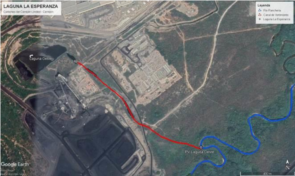
Imagen No. 1. Ubicación Geográfica de la Laguna Oeste. CARBONES DEL CERREJON LIMITED – CERREJON. COMPLEJO MINA. 02 de diciembre de 2019. (Fuente: Google Earth 2019).

Cabe mencionar que la Laguna Oeste se encuentra conectada con la Laguna Este, por medio de tuberías, en las cuales se utilizan bombas para mantener un balance hídrico entre las dos lagunas.