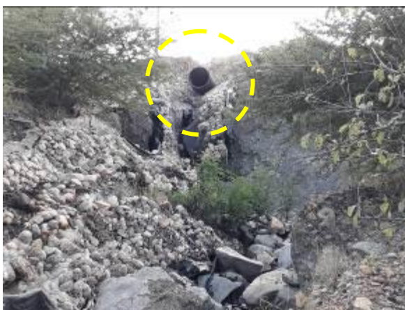
Fotografías No. 27 y 28. Salida de vertimientos con sedimentos de carbón de patios de carbón a la Laguna Oeste. CARBONES DEL CERREJON LIMITED – CERREJON. COMPLEJO MINA. 02 de diciembre de 2019..