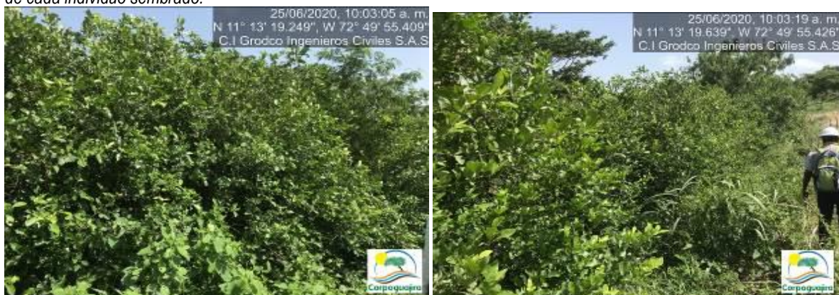
Fotografías No. 44 y 45. Siembra de cortina vegetal rompe vientos. C.I GRODCO INGENIEROS CIVILES S.A.S. 25 de junio de 2020.

En esta nueva visita se evidencio que el sistema implementado por la empresa C.I GRODCO INGENIEROS CIVILES S.A.S, está dando buenos resultados, se ve una siembra avanzada, con buen aspecto fitosanitario y un buen crecimiento de cada individuo sembrado.