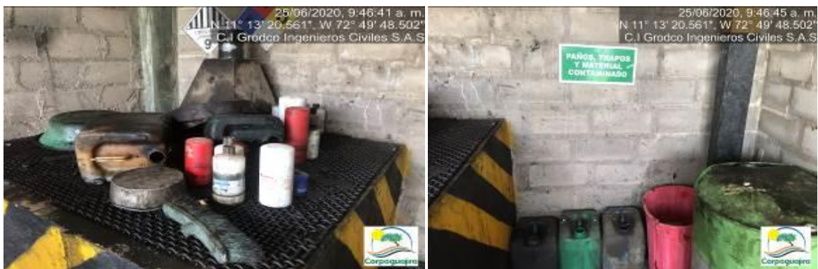
Fotografías No. 25 y 26. Almacenamiento de Respel. C.I GRODCO INGENIEROS CIVILES S.A.S. 25 de junio de 2020.

Por lo anterior, se considera que las acciones realizadas por la empresa C.I GRODCO INGENIEROS CIVILES S.A.S, se enmarcan como atenuante del riesgo, peligro o daño evidenciado sobre el medio ambiente en especial en el recurso suelo e incumplimiento a la normativa ambiental vigente; pero, el riesgo, peligro o daño evidenciado debe ser valorado en el proceso sancionatorio que se originó en contra de la empresa C.I GRODCO INGENIEROS CIVILES S.A.S.