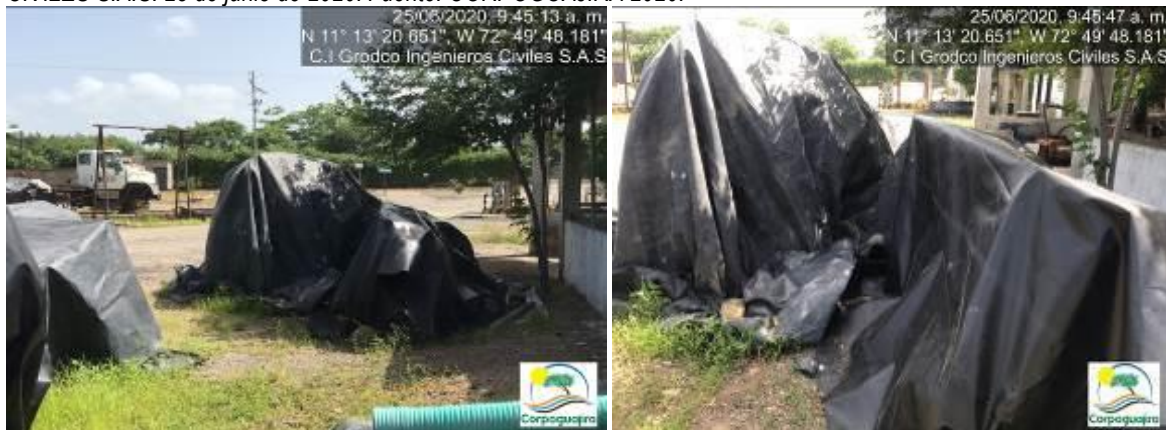
Fotografías No. 31 y 32. Equipos, vehículos y piezas cubiertos con Geomenbrana. C.I GRODCO INGENIEROS CIVILES S.A.S. 25 de junio de 2020.