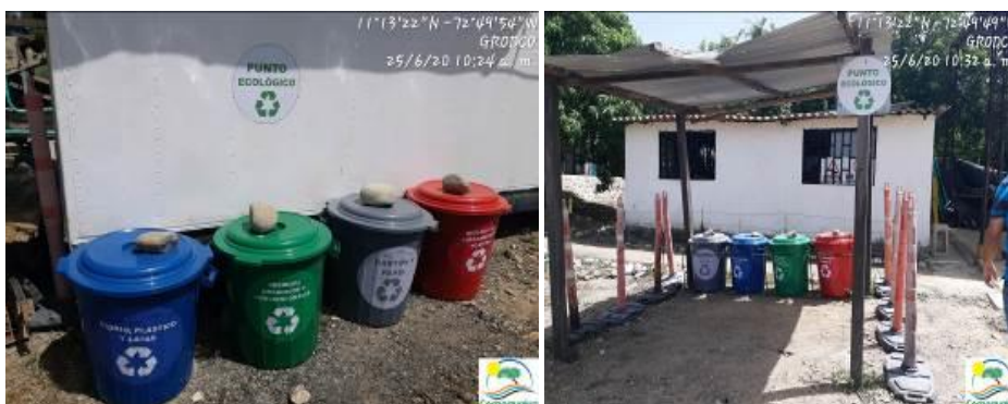
Fotografías No. 3 y 4. Instalación de nuevos puntos ecológico en áreas de la empresa. C.I GRODCO INGENIEROS CIVILES S.A.S. 25 de junio de 2020.

De acuerdo a lo evidenciado en campo se manifiesta que la empresa C.I GRODCO INGENIEROS CIVILES S.A.S realizo el cambio total de los contenedores utilizados para la recolección de los residuos ordinarios que genera en sus diferentes actividades, se pudo apreciar que los nuevos contenedores instalados en la empresa en mención, cuentan con las especificaciones que dicta la ley, como lo son: código de colores, marcación para cada tipo de residuos, etc. Se pretende por parte de la empresa que este cambio ayude a mejorar la recolección de los residuos generados en cada área de la empresa y así evitar el mal almacenamiento de los mismos.