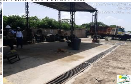
Fotografías No. 39 y 40. Área o sitio de realización de mantenimientos con medidas de control de residuos peligrosos. C.I GRODCO INGENIEROS CIVILES S.A.S. 25 de junio de 2020.

El otro punto identificado en el recorrido y seguimientos anteriores es el denominado “Almacenamiento de Hidrocarburos” el cual presenta una trampa de recolección de los residuos o desechos peligrosos que se generan, la empresa C.I GRODCO INGENIEROS CIVILES S.A.S, manifestó que esta trampa no cuenta con tubería de salida, debido a que las aguas aquí contenidas son retiradas manualmente y son dispuestas como residuo líquido peligroso, además manifiesta que las aguas que acá se producen son esporádicas, debido a que la Estación de Servicio no se encuentra en funcionamiento desde hace más de dos años, y que las aguas que aquí se recolectan son las del resultado de