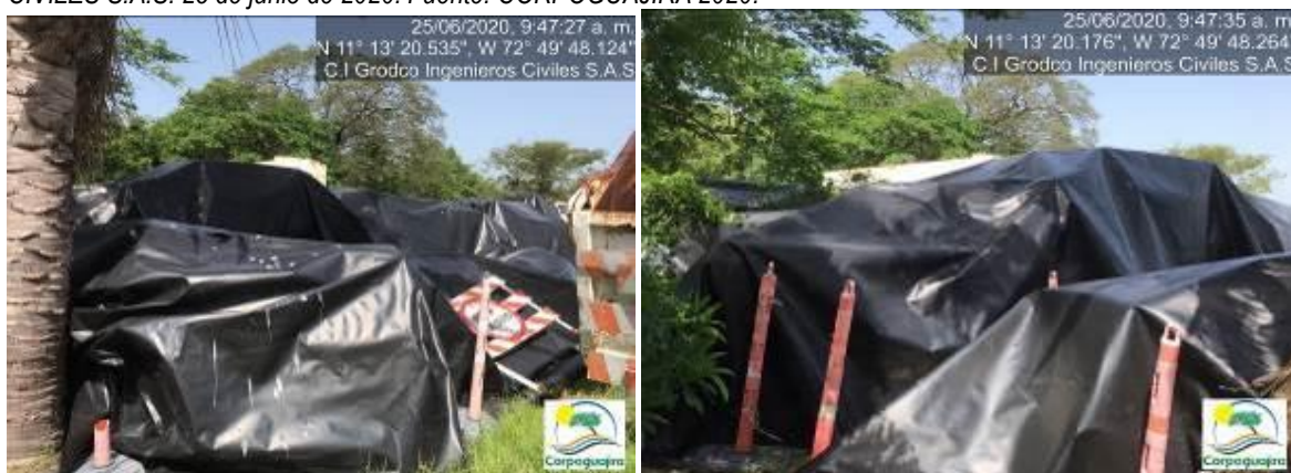
Fotografías No. 33 y 34. Equipos, vehículos y piezas cubiertos con Geomenbrana. C.I GRODCO INGENIEROS CIVILES S.A.S. 25 de junio de 2020.