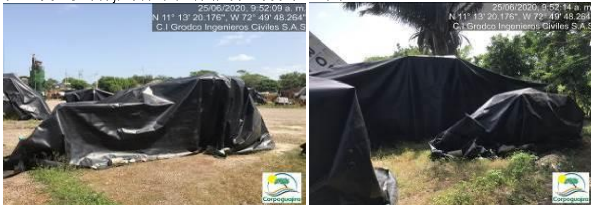
Fotografías No. 35 y 36. Equipos, vehículos y piezas cubiertos con Geomenbrana. C.I GRODCO INGENIEROS CIVILES S.A.S. 25 de junio de 2020.

Se anexa como evidencia de las acciones para el cumplimiento de esta obligación el acta suscrita por las directivas de la empresa C.I GRODCO INGENIEROS CIVILES S.A.S, con relación a las actuaciones a implementar en los equipos en desuso.