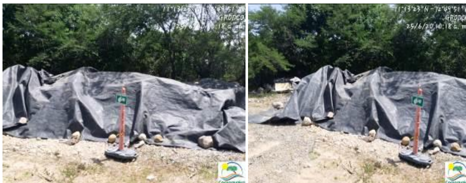
Fotografías No. 9 y 10. Almacenamiento temporal de material chatarra. C.I GRODCO INGENIEROS CIVILES S.A.S. 25 de junio de 2020.