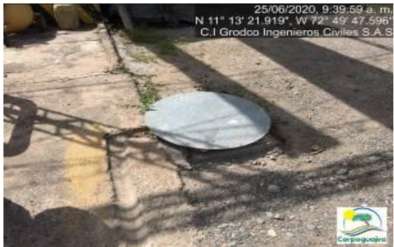
Fotografías No. 17 y 18. Sistema de recolección de aguas residuales no domesticas ARnD. C.I GRODCO INGENIEROS CIVILES S.A.S. 25 de junio de 2020.

En cuanto a los vertimientos de aguas recolectados por el canal que se encuentra en la parte trasera del área de soldadura y área de almacenamiento de Respel, se evidencio que a la cajilla o trampa recolectora de estas aguas, se le conecto un tubo el cual cumpliría la función de llevar estas aguas hacia un canal construido para la recolección de aguas lluvias y luego disponerlas en el sistema de tratamiento de vertimientos con que cuenta la empresa para el manejo de las aguas que van hacia la Quebrada Moreno.