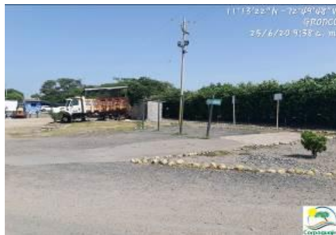
Fotografías No. 1 y 2. Limpieza de derrames de aceites e hidrocarburos en el suelo. C.I GRODCO INGENIEROS CIVILES S.A.S. 25 de junio de 2020.

Por lo anterior, se considera que las acciones realizadas por la empresa C.I GRODCO INGENIEROS CIVILES S.A.S, se enmarcan como atenuante del riesgo, peligro o daño evidenciado sobre el medio ambiente en especial en el recurso suelo; pero, el riesgo, peligro o daño evidenciado debe ser valorado en el proceso sancionatorio que se originó en contra de la empresa C.I GRODCO INGENIEROS CIVILES S.A.S.