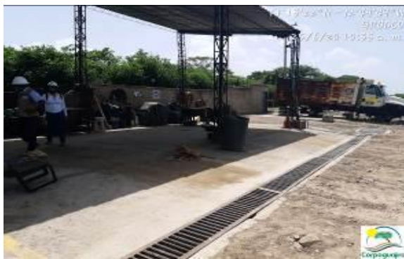
Fotografías No. 15 y 16. Canal y trampa de recolección de residuos líquidos, área de talleres. C.I GRODCO INGENIEROS CIVILES S.A.S. 25 de junio de 2020.

En cuanto a los vertimientos de aguas recolectados por el canal que se encuentra en la parte trasera del área de laboratorio y área de talleres de mantenimiento, se evidencio que se le realizo unas adecuaciones a la cajilla o trampa recolectora, el cual consistió en taparle todas las salidas de la misma, con la intención de que las aguas recolectadas en este sean succionadas de forma manual y sean tratadas también como aguas contaminadas o residuos peligrosos, la empresa C.I GRODCO INGENIEROS CIVILES S.A.S, manifiesta que estas aguas no son de carácter industrial, toda vez que estas son el resultados de las precipitaciones que se presentan en la zona, por lo cual tiene la intención de eliminar esta trampa y el canal de conducción de estas aguas.