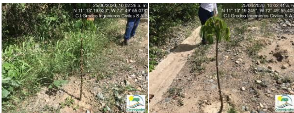
Fotografías No. 5 y 6. Limpieza de residuos ordinarios y/o convencionales. C.I GRODCO INGENIEROS CIVILES S.A.S. 25 de junio de 2020.

Para revisar las acciones implementadas por la empresa C.I GRODCO INGENIEROS CIVILES S.A.S para resarcir el daño, peligro o riesgo de contaminación ambiental identificado por la acumulación de desechos y materiales peligrosos a lo largo de las instalaciones, se procedió a realizar un recorrido por todos los puntos identificados, encontrándonos que la empresa en mención, realizo una recolección completa de todos estos materiales y desechos, en favor de eliminar y mitigar estos daños y riesgos, y al mismo tiempo en estas áreas fueron sembrados árboles para evitar que vuelvan a depositarse en estos desechos y materiales peligrosos. Aduce la empresa que estos residuos fueron recolectados y clasificados para luego ser entregados a la empresa recolectora de los mismos. La certificación de la disposición final de estos residuos se encuentra a la espera que sean enviados por la empresa recolectora para ser entregados a la autoridad ambiental como soporte.