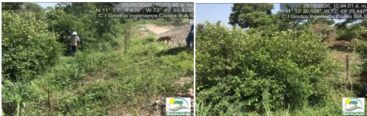
Fotografías No. 46 y 47. Siembra de cortina vegetal rompe vientos. C.I GRODCO INGENIEROS CIVILES S.A.S. 25 de junio de 2020.

Por lo anterior, se considera que las acciones realizadas por la empresa C.I GRODCO INGENIEROS CIVILES S.A.S, se enmarcan como atenuante en el incumplimiento a la normativa ambiental vigente; pero, dicho incumplimiento evidenciado debe ser valorado en el proceso sancionatorio que se originó en contra de la empresa C.I GRODCO INGENIEROS CIVILES S.A.S.