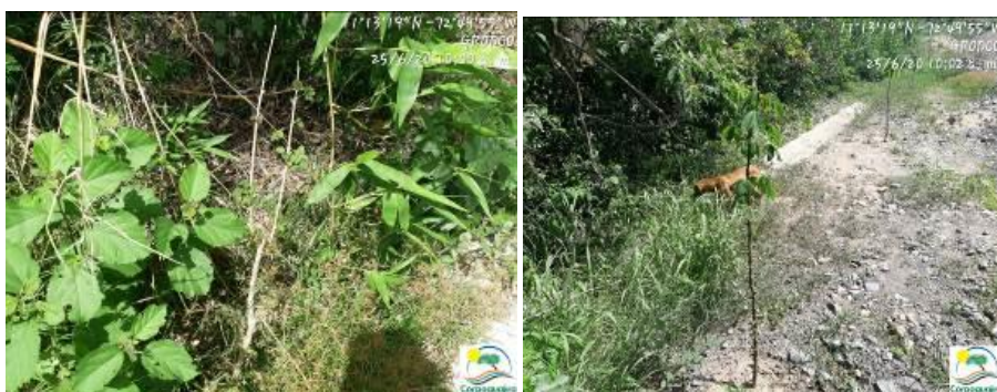
Fotografías No. 7 y 8. Limpieza de residuos ordinarios y/o convencionales y siembra de árboles en zonas afectadas. C.I GRODCO INGENIEROS CIVILES S.A.S. 25 de junio de 2020.

De acuerdo a lo evidenciado en campo se manifiesta que la empresa C.I GRODCO INGENIEROS CIVILES S.A.S realizó la recolección de todo el material estéril y los dispuso según su clasificación para ser entregados a la empresa recolectora, se menciona que estos materiales estériles se encontraban dispuestos en las mismas áreas mencionadas en el punto anterior y que en estas áreas fueron limpiadas y acondicionadas para la siembra de especies arbóreas como: Mata ratón ( Gliricidia sepium ) ceiba de agua ( Ceiba pentandra ) ceiba tolúa ( Ceiba speciosa ), entre otras especies.