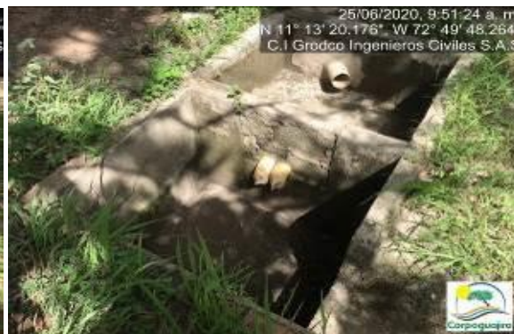
Fotografías No. 19 y 20. Sistema de recolección de aguas residuales no domesticas ARnD. C.I GRODCO INGENIEROS CIVILES S.A.S. 25 de junio de 2020.