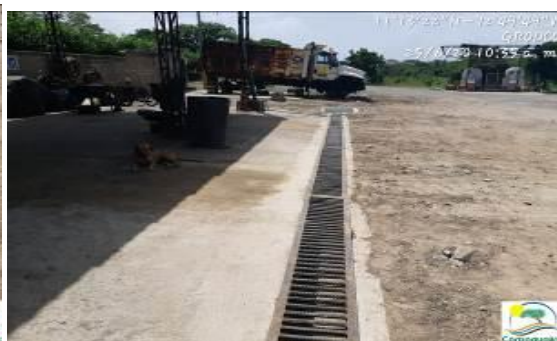
Fotografías No. 37 y 38. Área o sitio de realización de mantenimientos con medidas de control de residuos peligrosos. C.I GRODCO INGENIEROS CIVILES S.A.S. 25 de junio de 2020.