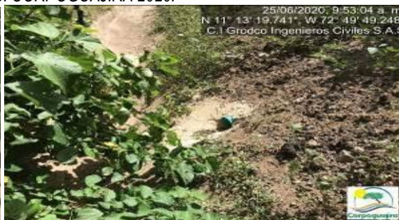
Fotografías No. 21 y 22. Sistema de recolección de aguas residuales no domesticas ARnD. C.I GRODCO INGENIEROS CIVILES S.A.S. 25 de junio de 2020.

Por lo anterior, se considera que las acciones realizadas por la empresa C.I GRODCO INGENIEROS CIVILES S.A.S, se enmarcan como atenuante del riesgo, peligro o daño evidenciado sobre el medio ambiente en especial en el recurso suelo e incumplimiento a la normativa ambiental vigente; pero, el riesgo, peligro o daño evidenciado debe ser valorado en el proceso sancionatorio que se originó en contra de la empresa C.I GRODCO INGENIEROS CIVILES S.A.S.