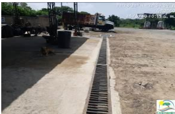
Fotografías No. 13 y 14. Canal y trampa de recolección de residuos líquidos, área de talleres. C.I GRODCO INGENIEROS CIVILES S.A.S. 25 de junio de 2020.