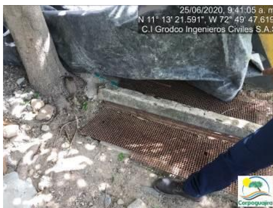
Fotografía No. 43. Trampa de recolección de residuos en área o sitio de acopio de hidrocarburos. C.I GRODCO INGENIEROS CIVILES S.A.S. 25 de junio de 2020.

Las aguas que son recolectadas en la parte interna de la Estación de Servicios con que cuenta la empresa C.I GRODCO INGENIEROS CIVILES S.A.S, son recolectadas en una trampa dispuesta en un costado de esta, dicha trampa cuenta con una tubería que sale de esta y va directamente a la trampa de recolección de residuos líquidos peligrosos. En la visita anterior se evidencio que el tubo que sale de la Estación de Servicios no se encontraba conectado a la trampa, lo cual era un foco de riesgo e impacto de contaminación ambiental, debido a que estas aguas iban a parar en el suelo aledaño a las instalaciones de la empresa.