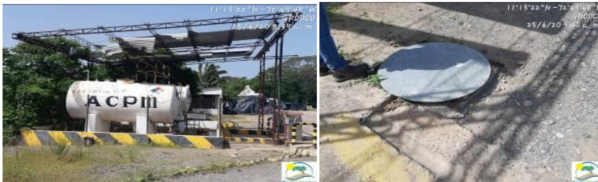
Fotografías No. 41 y 42. Área o sitio de acopio de hidrocarburos. C.I GRODCO INGENIEROS CIVILES S.A.S. 25 de junio de 2020.

precipitaciones de aguas lluvias en meses esporádicos. Adicional a lo anterior se manifiesta que estas instalaciones todavía presentan una condición precaria.