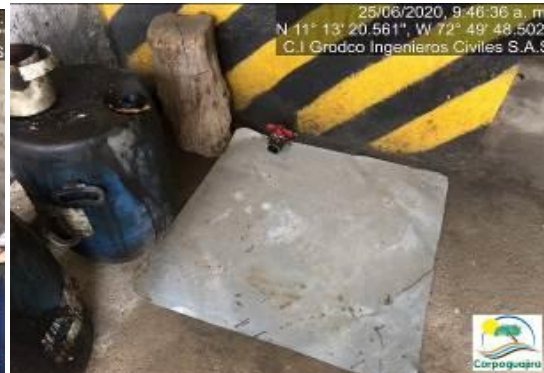
Fotografías No. 23 y 24. Almacenamiento de Respel. C.I GRODCO INGENIEROS CIVILES S.A.S. 25 de junio de 2020.