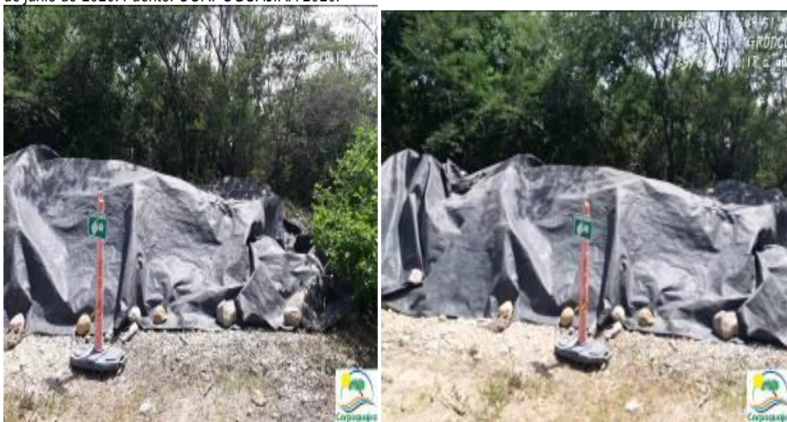
Fotografías No. 11 y 12. Almacenamiento temporal de material chatarra. C.I GRODCO INGENIEROS CIVILES S.A.S. 25 de junio de 2020.

Por lo anterior, se considera que las acciones realizadas por la empresa C.I GRODCO INGENIEROS CIVILES S.A.S, se enmarcan como atenuante del riesgo, peligro o daño evidenciado sobre el medio ambiente en especial en el recurso suelo e incumplimiento a la normativa ambiental vigente; pero, el riesgo, peligro o daño evidenciado debe ser valorado en el proceso sancionatorio que se originó en contra de la empresa C.I GRODCO INGENIEROS CIVILES S.A.S.