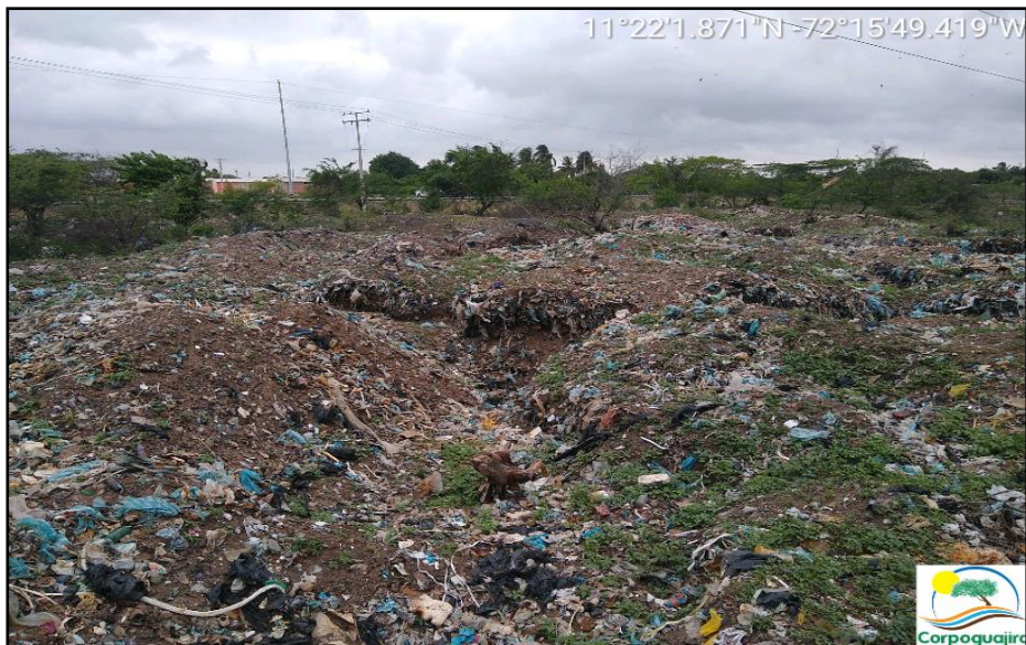
Figura 2. Residuos que en algún momento fueron enterrados.

En el sitio se observó una diversidad de residuos entre los que se pueden mencionar vidrio (de vidrierías), residuos de poda, lantas, aserrín, restos de vehículos, etc.