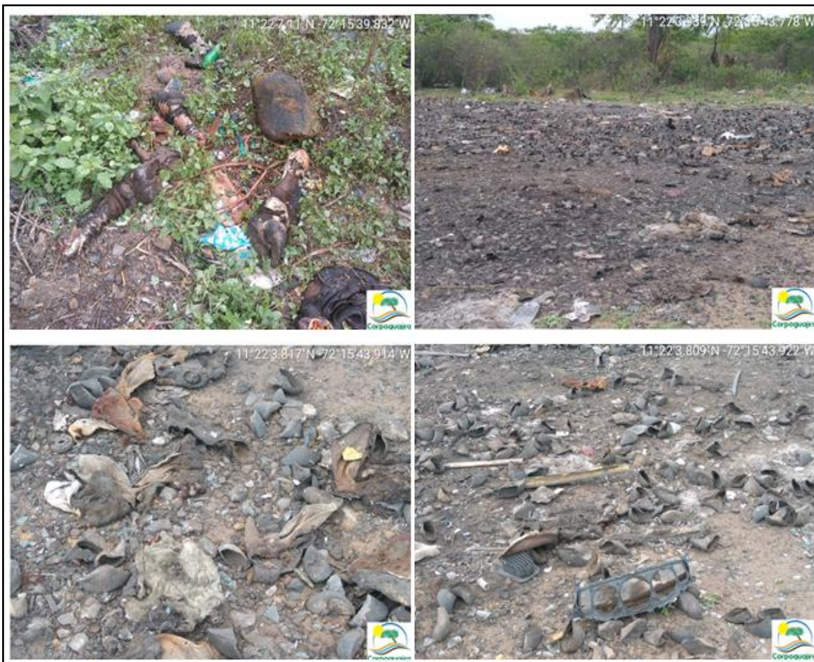
Figura 4. Restos de animales muertos.

Este tipo de residuos genera la presencia de diferentes animales de los cuales algunos pueden ser vectores transmisores de enfermedades (como moscas y mosquitos de los cuales había una gran cantidad). En el sitio se logró observar presencia de aves de rapiña (gallinazos), perros y chivos; estos últimos pueden en algún momento ser consumidos por las personas.