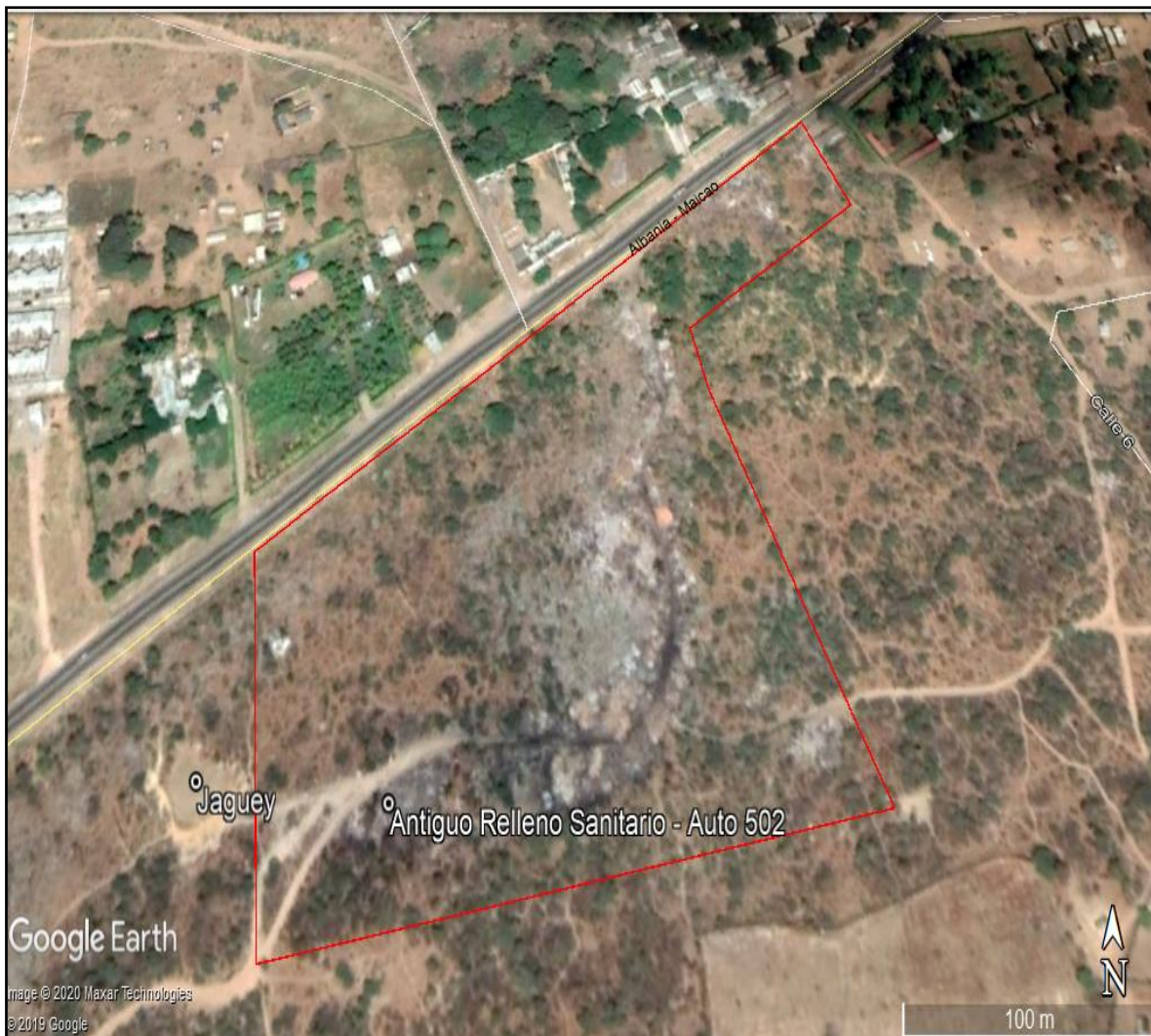
Figura 6. Área afectada por la disposición inadecuada de residuos sólidos.

Comentan los lugareños que los impactos que se generan en la zona del antiguo relleno sanitario de Maicao pueden causar afectaciones a la salud respiratoria de los habitantes de los barrios Brisas del Parrantial y Altos del Parrantial debido a los olores desagradables y al humo de las llantas que son quemadas en el área.