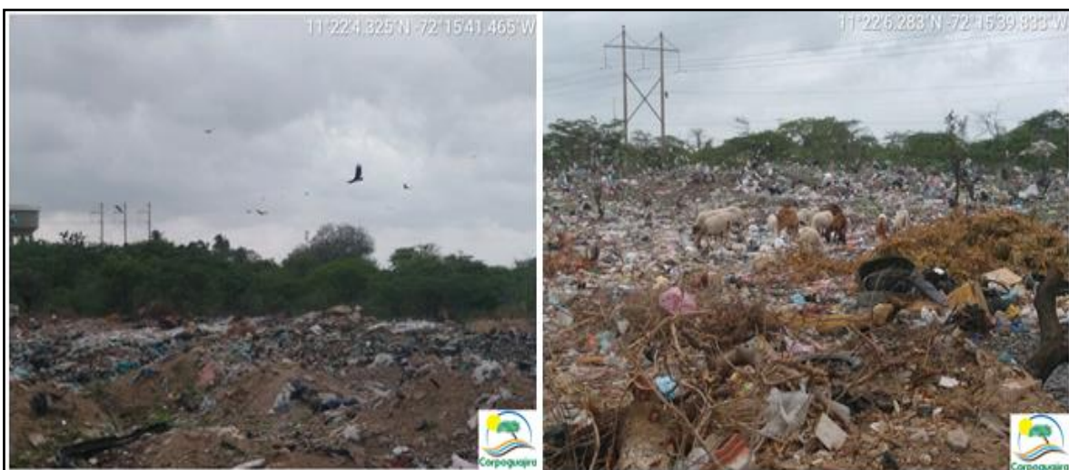
Figura 5. Animales observados en el sitio.

Este tipo de residuos genera la presencia de diferentes animales de los cuales algunos pueden ser vectores transmisores de enfermedades (como moscas y mosquitos de los cuales había una gran cantidad). En el sitio se logró observar presencia de aves de rapiña (gallinazos), perros y chivos; estos últimos pueden en algún momento ser consumidos por las personas.