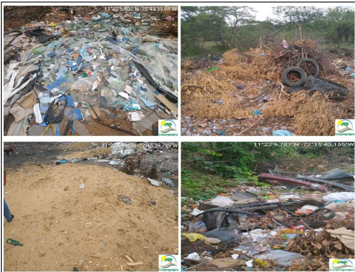
Figura 3. Diversidad de residuos observados.

En el sitio se observó una diversidad de residuos entre los que se pueden mencionar vidrio (de vidrierías), residuos de poda, lantas, aserrín, restos de vehículos, etc.