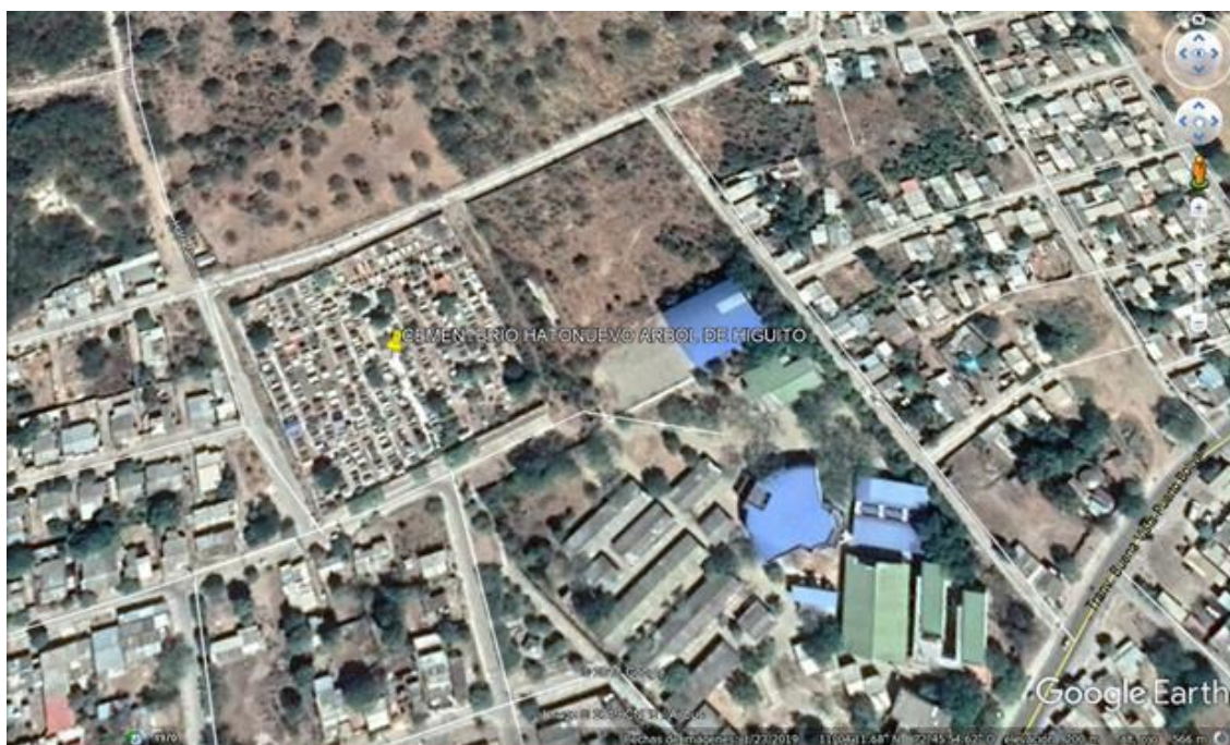
Fig. 2. Cementerio central

US Dept of State Geographer 2018 INEGI, 2018 Google