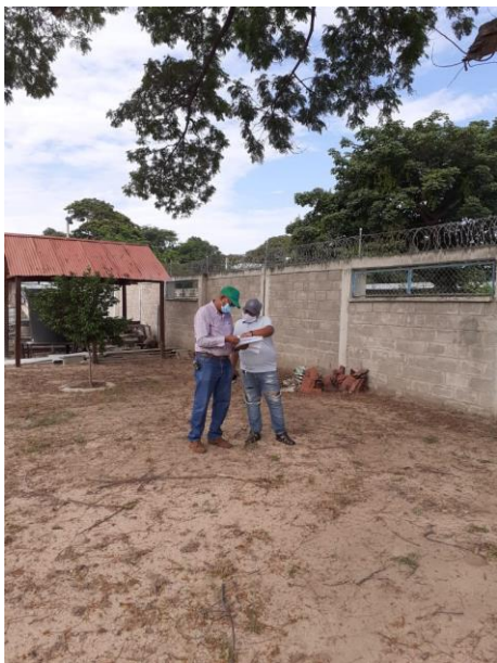
Img 6. Socialización del procedimiento