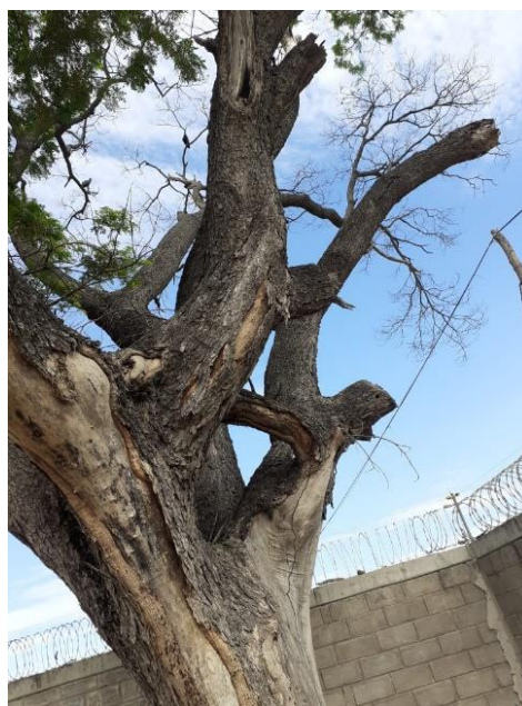
Img (4 – 5). Arbol 2 de Algarrobillo en mal estado fitosanitario