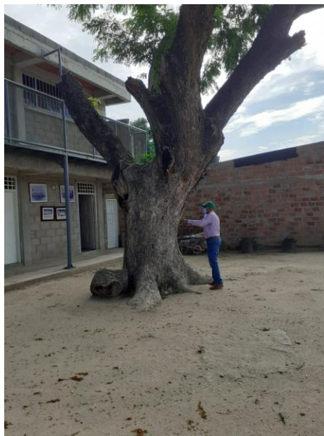
Img (2 – 3) Arbol 1 de Algarrobillo en mal estado fitosanitario.

2. Árbol 02 Especie ( Samanea saman ), Coord. Geog. Ref. 10°53'28.87"N, - 72°51'45.82"O. (Datum WGS84) El segundo árbol también es de la especie Algarrobillo. Este presenta un D.A.P. de 1,48 m , posee una altura estimada de 15 m , con un volumen de biomasa de 18,064 m 3 , este árbol al igual que el primero presenta ramas secas, cuenta con presencia de insectos xilófagos como isópteros (termitas) los cuales aceleran el proceso de descomposición de la estructura física del árbol y degrada la salud del mismo, el árbol se encuentra ubicado a escasos centímetros del muro o tapia del colegio, las ramas secas del árbol podrían ocasionar algún daño a la infraestructura del colegio o provocar algún factor de riesgo a las personas (alumnos, docentes, administrativos docentes, padres de familia, entre otros) que suelen encontrarse cerca al árbol.