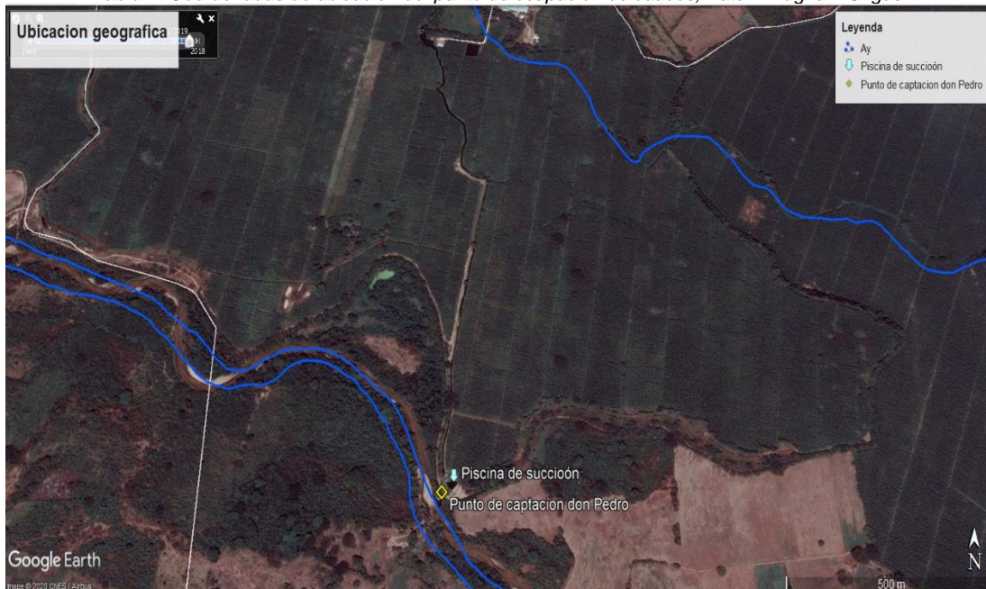
Tabla 1. Coordenadas de ubicación del punto de ocupación de cauces, Datum Magna – Sirgas

predio Don Pedro donde existe una impulsión de las aguas con una motobomba a gas natural la cual envía las aguas hacia un canal entierra por donde circulan las aguas hasta los reservorios que se encuentran ubicados dentro del predio antes mencionado.