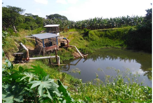
Imagen 4. Piscina de succión donde descarga la captación