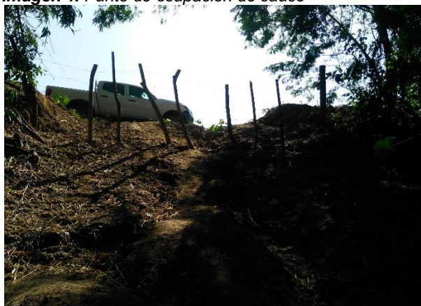
Imagen 3. Tramo del talud del río con tubería enterrada