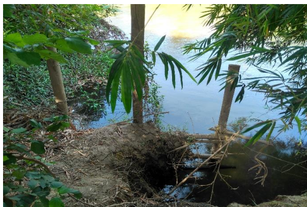
Imagen 1. Punto de ocupación de cauce