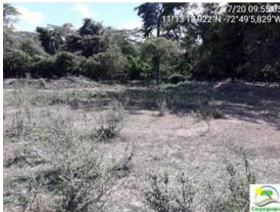
Foto 3: Jarillón o dique de contención - Lagunas de Oxidación del corregimiento de Monguí – Riohacha La Guajira