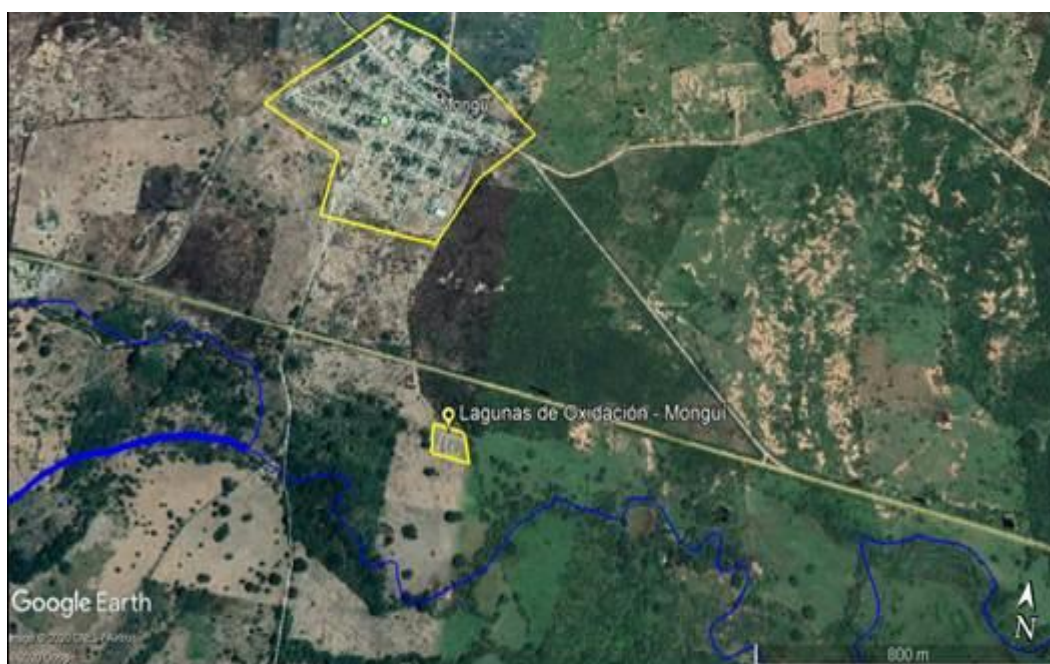
Imagen 1: Ubicación Geográfica de las Lagunas de Oxidación del corregimiento de Monguí – Riohacha La Guajira