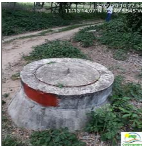
Foto 4: Alcantarilla 1, a la salida de las Aguas Residuales procedentes de las Lagunas de Oxidación del corregimiento de Monguí – Riohacha La Guajira