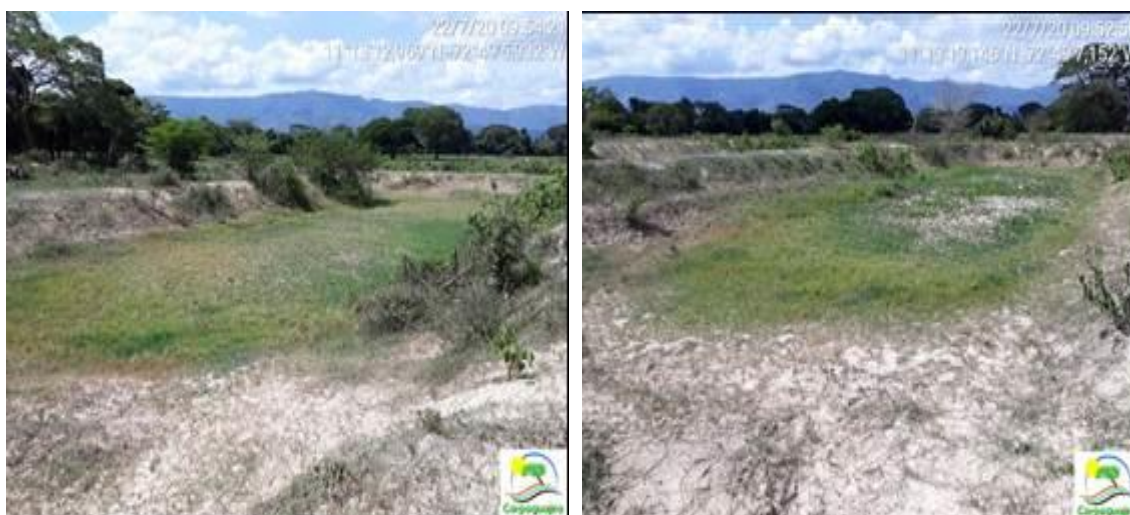
Fotos 1 y 2: Estado actual de las Lagunas de Oxidación del corregimiento de Monguí – Riohacha La Guajira